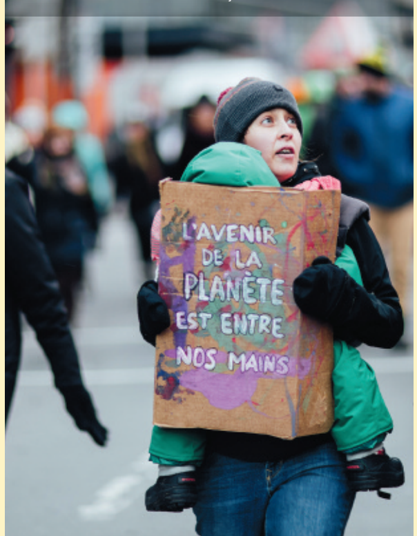
Manifestation La planète s'invite au Parlement à Montréal, le 10 novembre 2018.