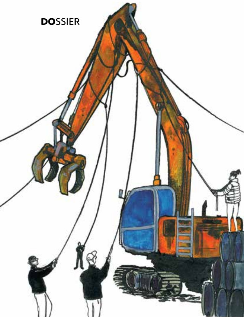
Étienne Prud'homme, La pelle , 2019, aquarelle et encre de Chine, 18 x 25,5 cm

qui aide à le diviser et à le réprimer davantage. Tristement, ce mouvement ne bénéficie pas de la solidarité internationale qui peut faire la différence, comme lors du boycott des produits sud-africains à l'échelle mondiale qui a contribué à la fin du régime d'apartheid.