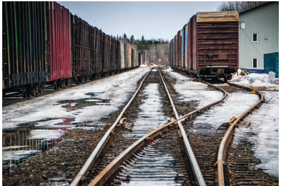
Parent, en Haute-Mauricie.

se d'accompagner et de financer des grands joueurs du secteur minier sans adopter de politique industrielle. Il y a donc une déconnexion avec ce qui se fait déjà au Québec en termes de production de biens utiles, de leviers financiers ou d'aménagement du territoire. S'il y a un développement à faire dans le nord du Québec, il ne doit pas être coupé de celui du sud. Il doit d'abord se faire en harmonie avec les activités qui sont déjà présentes sur tout le territoire.