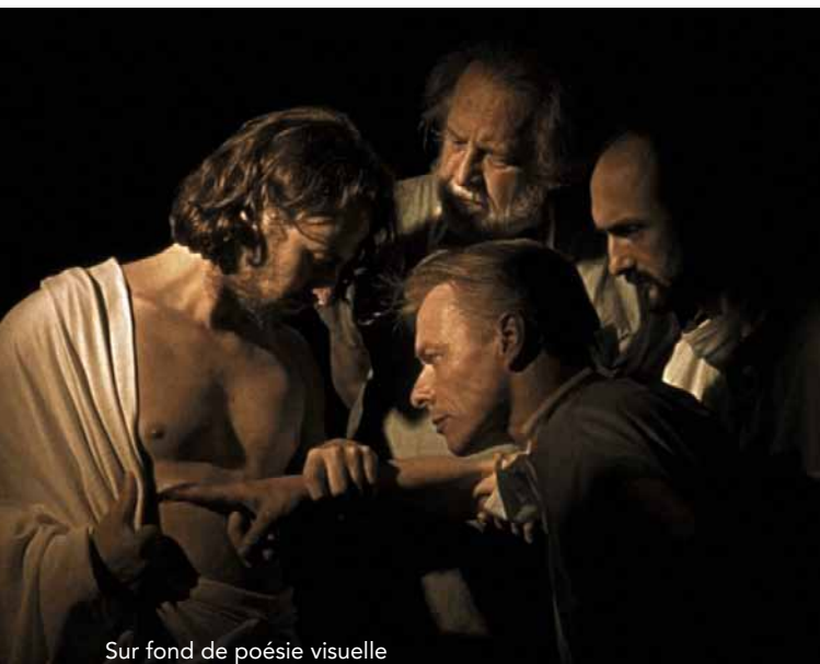
Sur fond de poésie visuelle