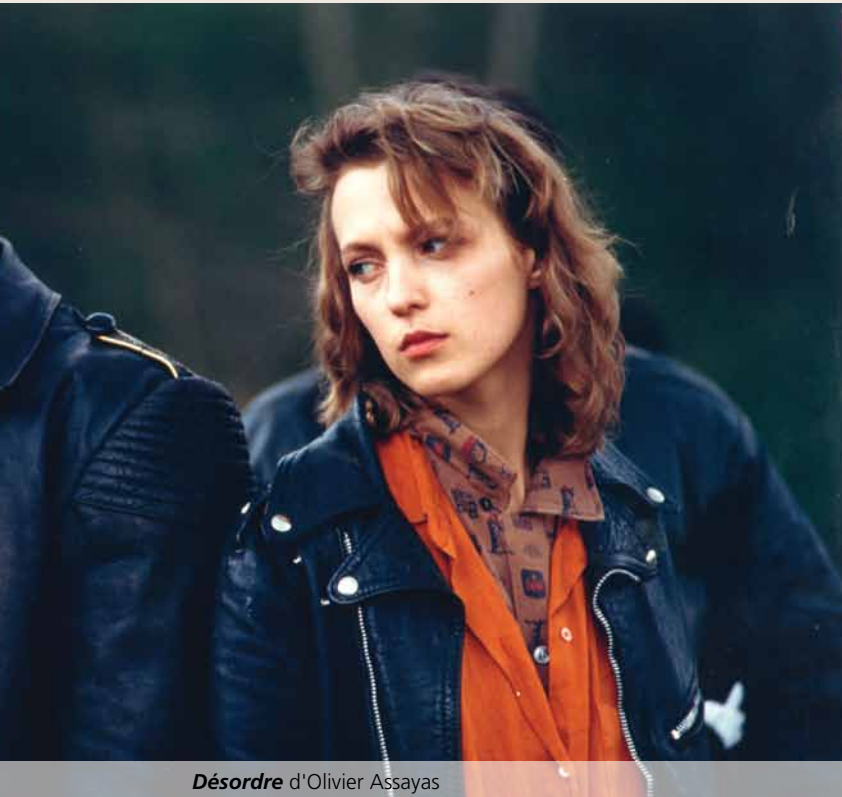
Désordre d'Olivier Assayas

remportent. C'est plutôt marrant de voir les réactions que l'émission suscite. Parfois, je rencontre des gens qui m'en parlent. Des gens plus jeunes aussi... Je me dis que je me reconnecte avec une nouvelle génération à travers cette expérience-là.