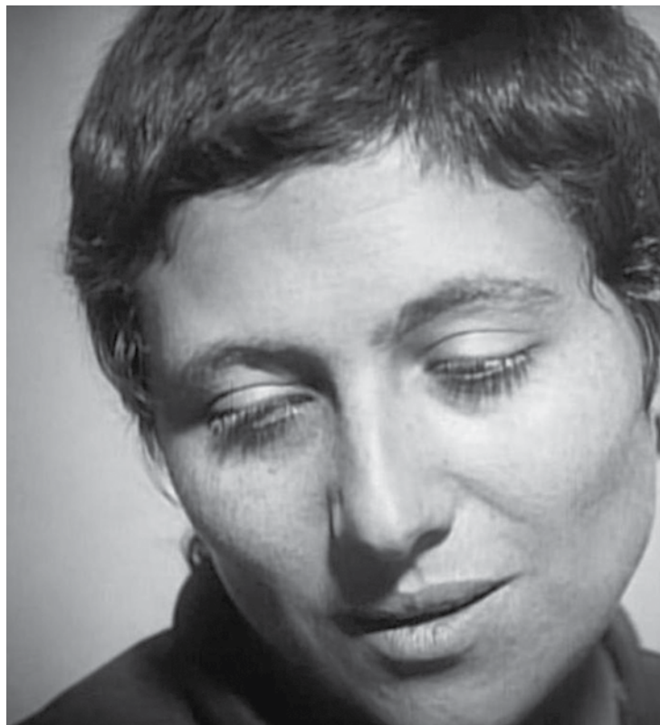
La Passion de Jeanne d'Arc de Carl Theodor Dreyer

l'arrière d'un tramway dans Rocco et ses frères ( Rocco e i suoi fratelli ) de Luchino Visconti où, derrière Alain Delon et Annie Girardot, le décor urbain que l'on quitte se laisse embrasser du regard. Ces deux formules visuelles reviennent souvent dans la série, le phantom ride pour entrer dans un pays sur les rails ou passer d'un pays à un autre de manière rapide et le plan pris d'un véhicule automobile souvent par la fenêtre ou dans un cadre plus restreint dans une rue bondée ou vide montrant la vie de Dakar, de Delhi ou d'ailleurs.