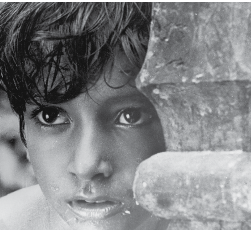
Panther Panchali de Satyajit Ray