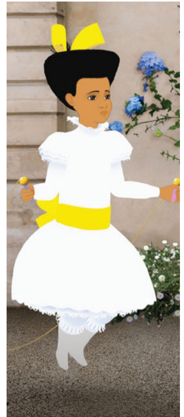
— Se tenir toujours debout

Finalement, en campant son film dans le Paris de la Belle Époque, un temps riche en progrès scientifiques et en créations artistiques, Ocelot fait valoir les avantages d'une période riche en solutions et en avancées. Il nous invite à croire que des avancées sont possibles et que des solutions aux maux de notre époque sont à portée de main. Ce film, féministe, politique, engagé et profondément humain constitue déjà une partie de la solution. ▲