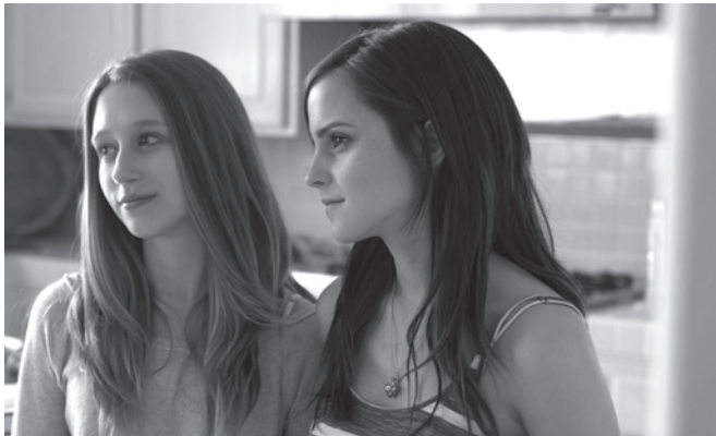
Contempler le mal de vivre

Si The Bling Ring joue sur des bases déjà bien tracées, il n'est pas moins intéressant. Cet intérêt est double. D'une part, on se demande en le regardant: quelle place prend-il dans le corpus de son auteure? À quarante ans, Sofia Coppola arrive à l'heure des premiers bilans de son cinéma. D'autre part, il convient de rappeler la proximité de son dernier film avec deux autres sortis durant les derniers mois, Spring Breakers et After Lucia , qui – à leur manière tout à fait opposée (la vulgarité clipsique de Korine vs le réalisme documentaire de Franco) – partagent le même sujet, à savoir une jeunesse à la dérive souffrant de l'absence / indifférence de son entourage ( After Lucia ), projetée dans un fantasme toxique ( Spring Breakers , The Bling Ring ).