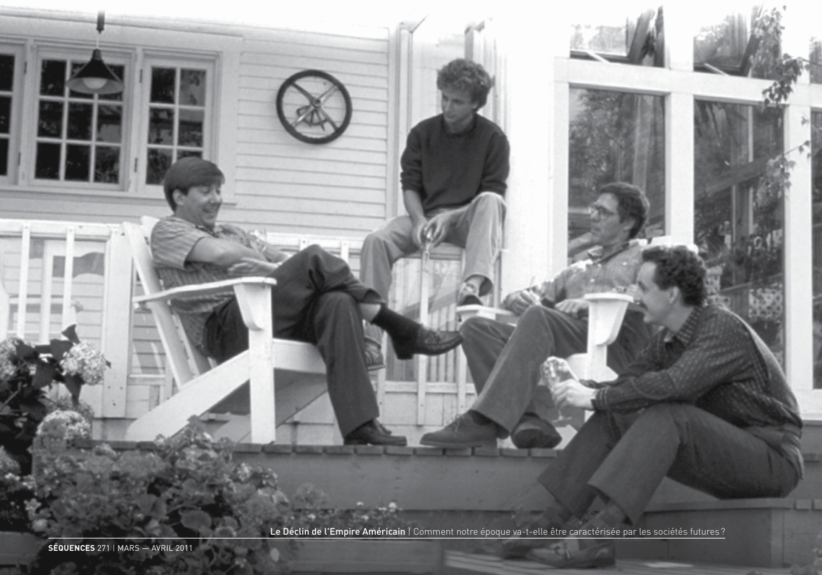
Le Déclin de l'Empire Américain | Comment notre époque va-t-elle être caractérisée par les sociétés futures ?

Ça, c'est fatal. Dans tous les pays, il y a d'étranges correspondances entre les sujets qu'abordent les cinéastes ou les écrivains. Quand j'ai commencé à travailler sur Jésus de Montréal , après Le Déclin de l'empire américain , quelqu'un est venu me voir en disant: «Tu ne peux pas faire ça, je viens d'apprendre que Martin Scorsese va tourner The Last Temptation of Christ la semaine prochaine!» J'ai dit: «Pourquoi je ne le ferais pas? Ça ne change rien.» Il n'était pas question que je change de sujet. Mais, pour revenir à votre citation, Fellini a effectivement fait Le Satyricon , qui portait sur