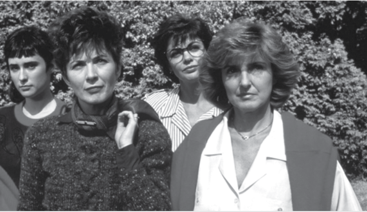
Le Déclin de l'empire américain | Une nouvelle classe petite-bourgeoise

Les gens craignaient la guerre froide, l'accumulation des bombes thermonucléaires. Puis, un bon matin, ils se sont levés : le mur de Berlin était tombé. C'était fini... C'est la même chose aujourd'hui. Dans dix ans, l'avenir sera peut-être radicalement différent de tout ce qu'on peut imaginer. Et puis, soit dit en passant, les historiens sont assez humbles par rapport à ces « prédictions ». On a déjà de la difficulté à comprendre un passé qui est documenté. Alors, imaginez l'avenir... On oublie ça ! (Rire)