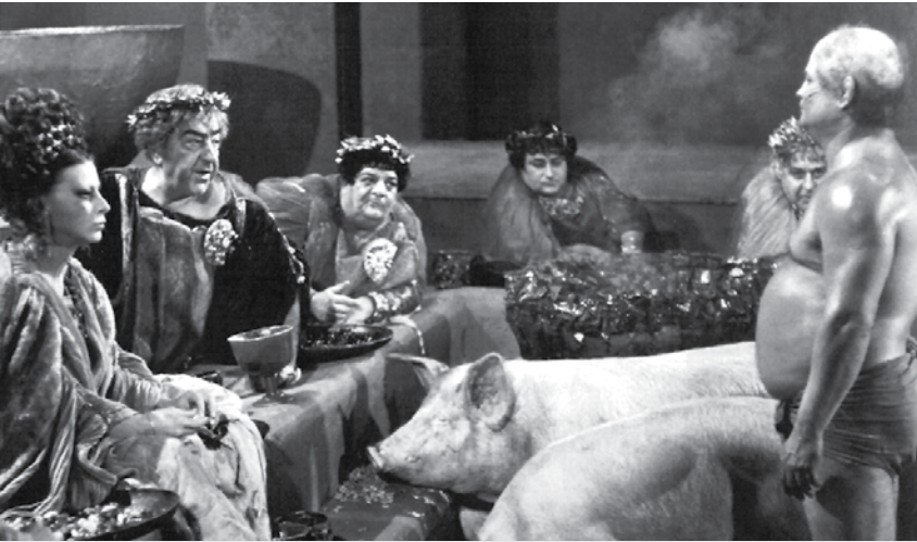
Satyricon | Le reflet exacerbé de notre propre décadence

la décadence de l'Empire romain. Et cette parenté de pensée, de préoccupation, on ne peut pas y échapper. On parle ici individus, surtout des Occidentaux, qui participent tous de la même culture, et qui s'interrogent sur l'époque dans laquelle nous vivons? Quelles sont ses principales caractéristiques? Vers où allons-nous? Ce sont là des questions que les artistes se posent tout le temps. C'est sûr qu'il va y avoir des concordances, des recoupements. C'est inévitable... En ce qui concerne la notion de déclin, le titre de mon film, Le Déclin de l'empire américain , vient simplement du fait que je me disais: « Ces gens-là, qui sont des historiens, parce que mes personnages sont des universitaires, ils vont se poser la question: "Comment notre époque va-t-elle être caractérisée par les sociétés futures?" ». Si on y pense bien, la fin du 20 e siècle et tout le 21 e siècle, ça va être le Déclin de l'empire américain. Ça ne peut être que ça. Les États-Unis ont établi leur hégémonie sur le monde au début du 20 e siècle, mais malheureusement, ça ne va plus durer très longtemps! La muraille commence à montrer des failles; elle va finir par s'écrouler. C'était ça, la naissance du titre, si vous voulez.