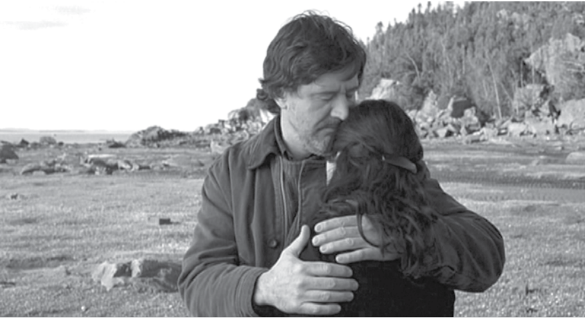
Trois temps après la mort d'Anna