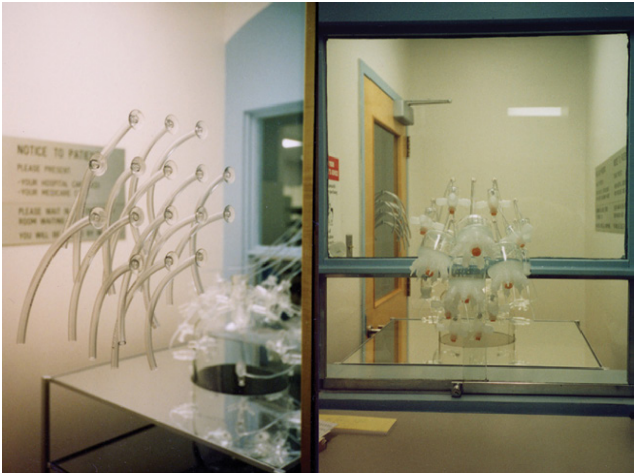
Les espaces différents , 1995 Installation au département de pharmacie de l'Hôpital général de Montréal.