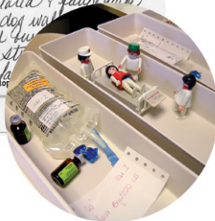
Histoire contre macaron, 1995-2007 Intervention au département des soins intensifs chirurgicaux de l'Hôpital général de Montréal.

Merci de ne pas nommer les gens ni les lieux. Please do not name people or places.