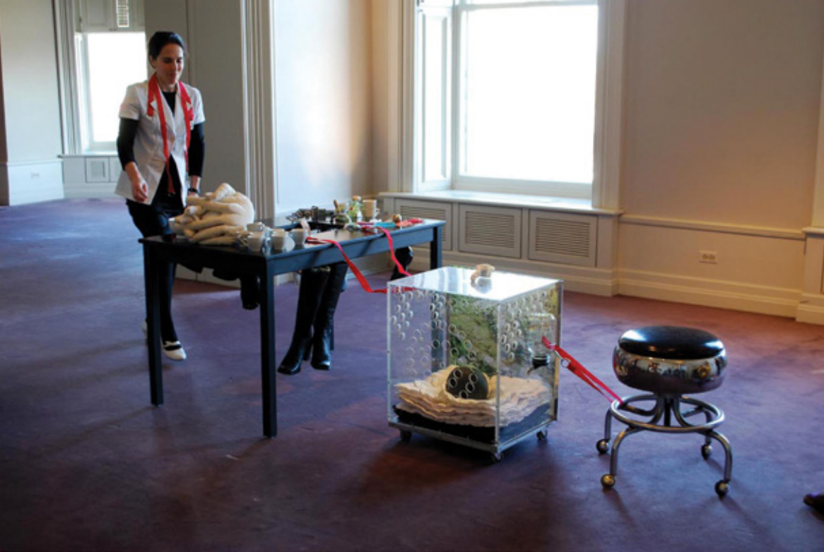
La cartographie du soi , 2012 Performance Centre Canadien d'Architecture, Montréal.