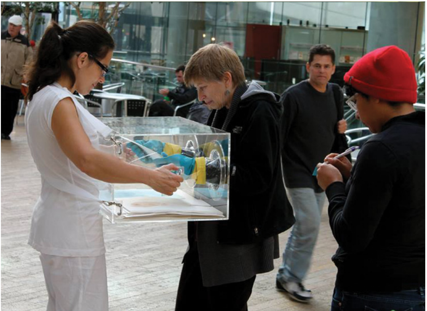
L'incubateur à texte et à dessins , 2014 Performance, PAF - Performance Art Festival, Salt Lake City.