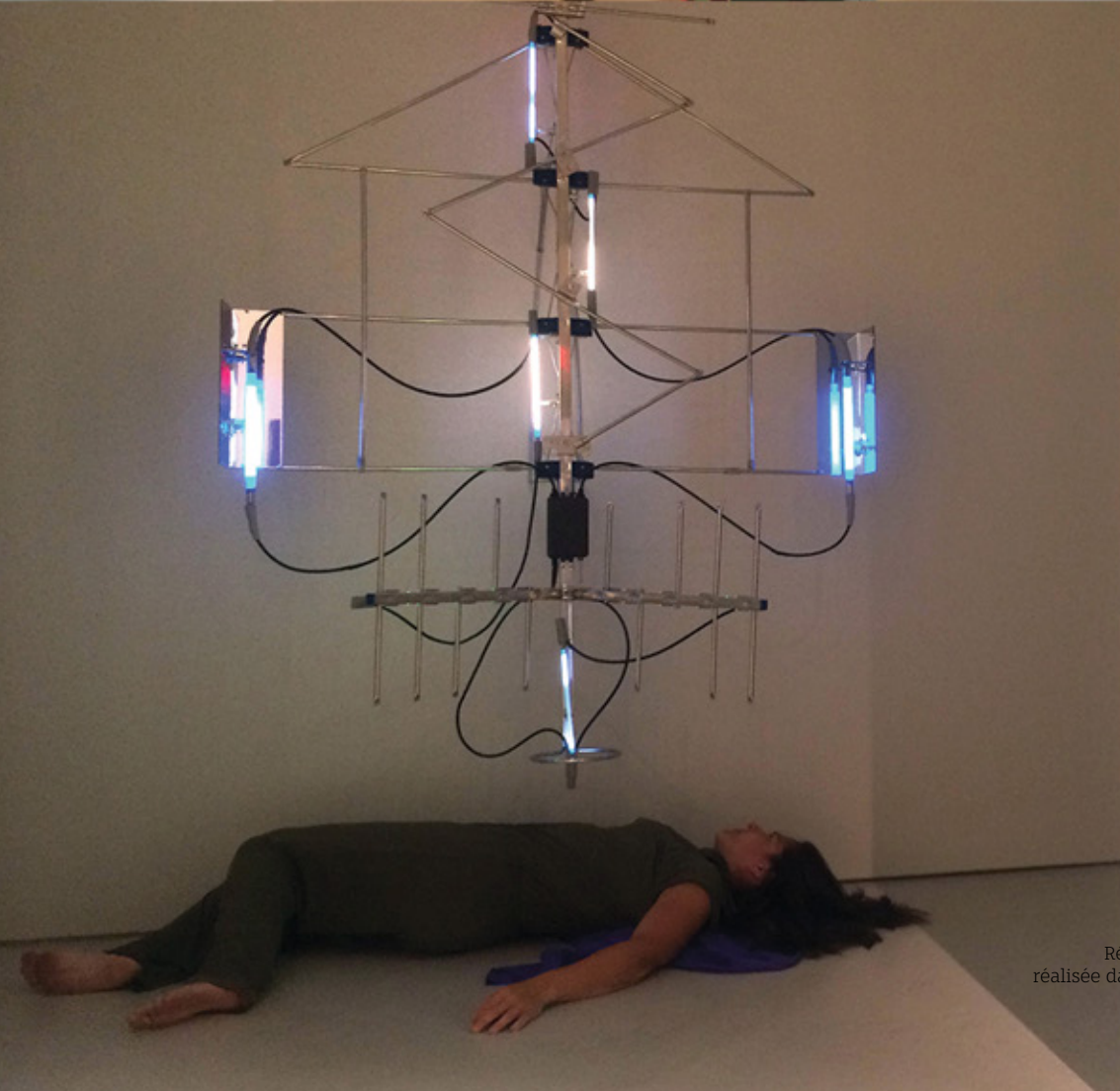
Faustine , 2016 Résidence performative de cinq jours et quatre nuits réalisée dans le cadre de l'exposition Le catalogue des futurs de Stéphane Gilot au Musée d'art de Joliette.