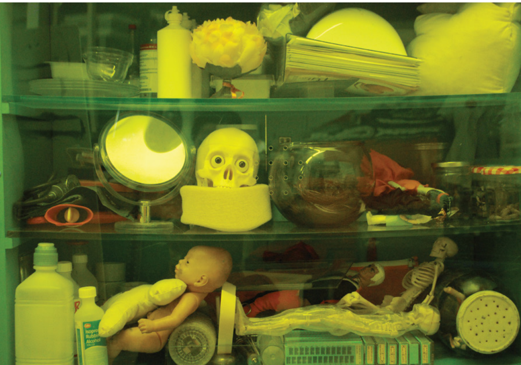
La cartographie du soi , 2012 Installation (détail), Centre Canadien d'Architecture, Montréal.

La notion de performance se perçoit ici dans le geste d'aller vers l'autre, de récolter, de mettre en circulation, dans cette implication du corps comme agent de liaison. Là, dans le corps qui pose des gestes dans un certain cadre, qui accomplit des actions dans un certain environnement. Et c'est grâce à l'articulation de plusieurs disciplines que Boileau parvient à ses fins : dessin, performance photographique et vidéo-graphique, installation performative, action dans l'espace public. Parfois, elle infiltre un milieu - une exposition, un centre hospitalier - pour en activer des aspects endormis. D'autres fois, dans l'espace public ou dans le cadre d'une installation artistique, elle s'assoit et écoute, traduit et interprète. Chaque fois, elle travaille avec les particularités d'un nouvel environnement,