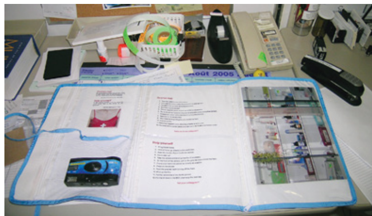
Ouvrez-moi / Help Yourself , 1995-2007 Intervention au département de pharmacie de l'Hôpital général de Montréal.