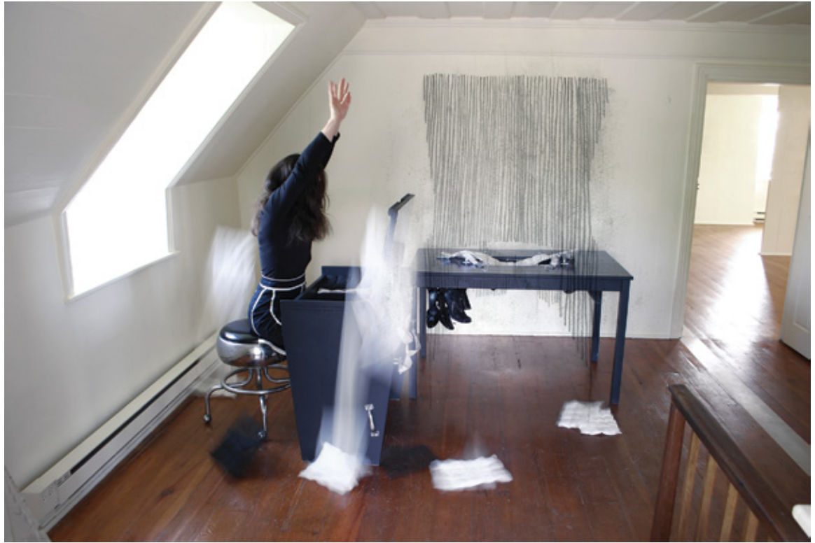
La chambre de L... , 2011 Performance photographique réalisée dans l'installation présentée à la Biennale internationale du lin de Portneuf, Deschambault.

Cette collecte de récits anonymes et cette oreille tendue vers l'autre prennent forme dans divers projets. Si les récits que Boileau récolte ne lui permettent d'accéder qu'à une infime partie d'un individu, elle réussit somme toute à composer une histoire qui, bien que fictive et subjective, est composée d'éléments pourtant bien réels.