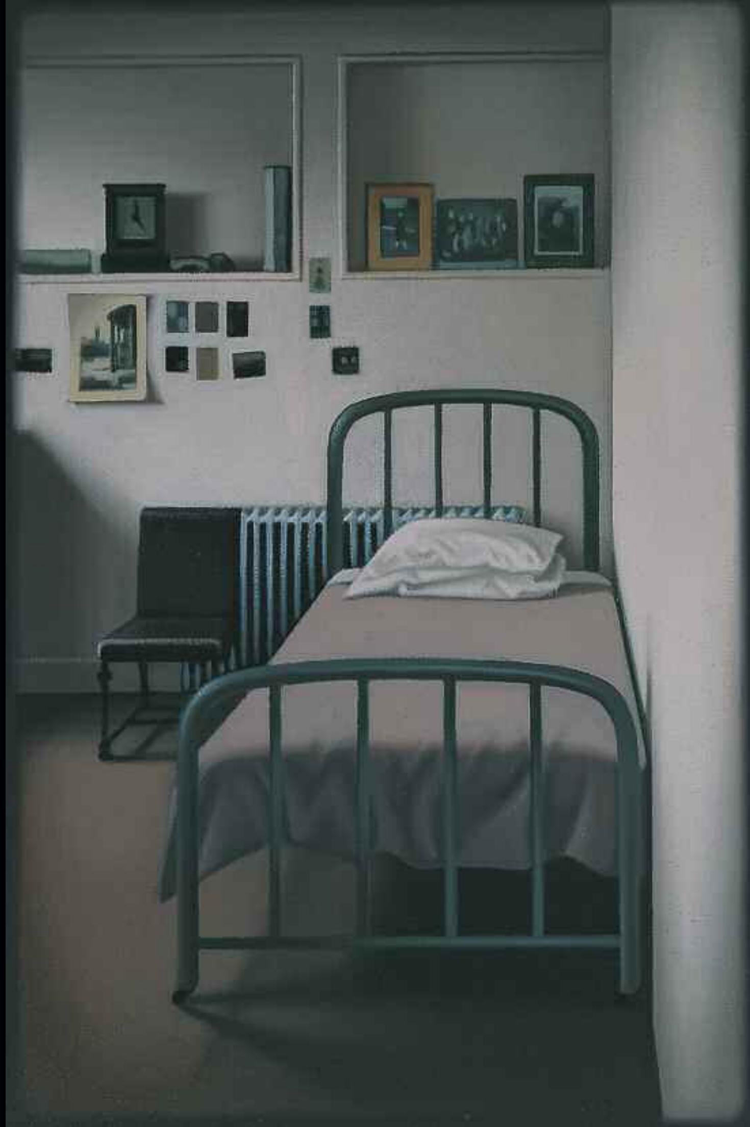
La Chambre à l'atelier, 1996. Huile sur toile de lin, 61 x 49,6 cm. Collection particulière.