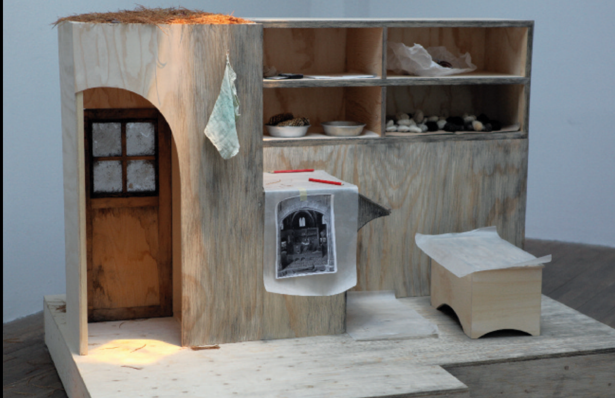
Elle marche. Blue Mountain , 2012, exposition performative, Oboro, Montréal (vue de l'installation).