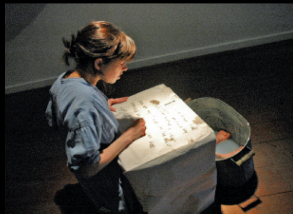
Acts of Carbon , 2009, installation performative, Hamilton Artists Inc.

Cet état hybride se canalise dans Cantastoria : a drawn opéra / un opéra dessiné (2010), qui investit le site d'une écurie vétuste, friche d'une activité cochère autrefois florissante. Sous influences tramées, l'installation performative invoque l'esprit des « malinas », refuges improvisés dans les soubassements des demeures qui furent pour certains salutaires au temps de la Shoah. Elle évoque aussi celui de Malina , de l'écrivaine autrichienne Ingeborg Bachmann, où couve ce passé trouble et qui raconte la relation d'une femme avec deux êtres, l'un expressif, l'autre secret — traits clairs-obscurs inhérents à l'œuvre de Vida Simon, me semble-t-il. Gestes, objets, sons et images ont profilé des pans de ces réalités parallèles, ces corps et leurs ombres projetés et réfractés dans l'espace sous l'action d'un jeu direct et tamisé, par écran et films de transparence. Je me souviens de Vida maniant la matière de ce récit, démesuré et rétréci, d'une boîte lumineuse, d'un groupe de femmes pareillement affairées à une table, d'oiseaux de papier fendant l'air d'une tension. Nous sommes descendus dans l'antre d'une dimension fabuleuse, rapiécant des époques passées et actuelles, fouillant dans les poches et doublures. C'est ainsi que le lieu est re-devenu le théâtre de l'histoire.