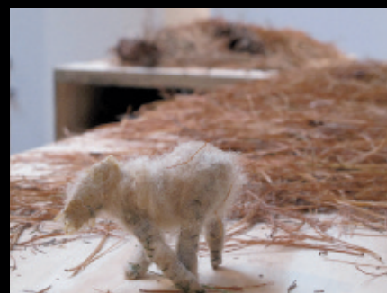
Elle marche. Blue Mountain , 2012, exposition performative, Oboro, Montréal (détail d'installation).