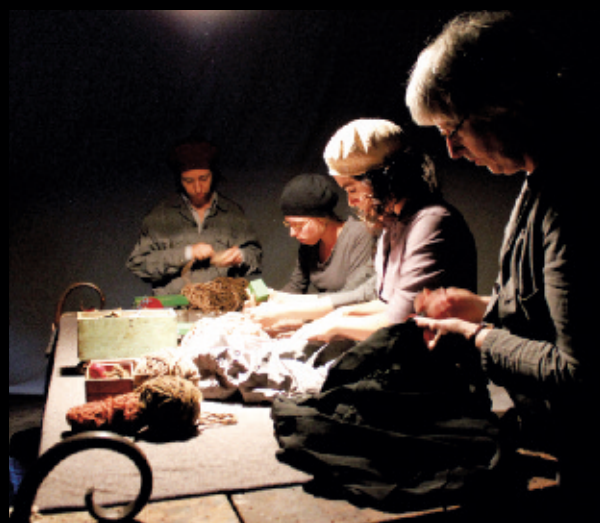
Cantastoria, a drawn opera / un opéra dessiné , 2010, installation performative, Montréal (vue des femmes qui travaillent à la table).

L'univers de Vida, c'est un potentiel en marche dans lequel on entre et on sort par de multiples brèches, où l'histoire — celle qui nous est contée, que l'on projette et qui remue les souvenirs — s'esquisse au présent, où l'interlocuteur joue un rôle, s'il le souhaite.