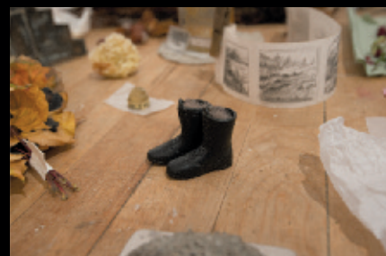
Elle marche. Blue Mountain , 2012, exposition performative, Oboro, Montréal (détail d'installation).