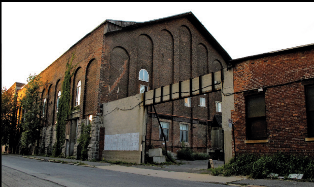
Cantastoria, a drawn opera / un opéra dessiné , 2010, installation performative dans une ancienne écurie, Montréal (vue de l'extérieur).

Dans le monde de Vida Simon, la narration se tient toujours sur un fil, nouant des réels alternatifs aussi palpables que fugaces, attachant une panoplie d'éléments par un savoir-faire où les coutures sont visibles, comme si l'endroit et l'endos du décor étaient pris dans un même temps, celui de la performance. Le site et les scènes de sa démarche sont balisés par un scénario initiateur dont les actes se réalisent in situ , en phase avec l'environnement.