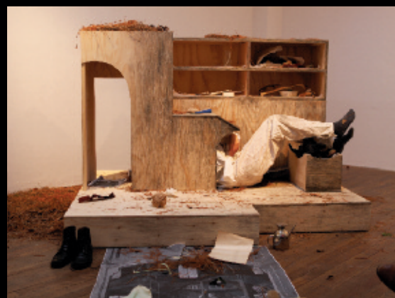
Elle marche. Blue Mountain , 2012, exposition performative, Oboro, Montréal (moments de la performance devant public).