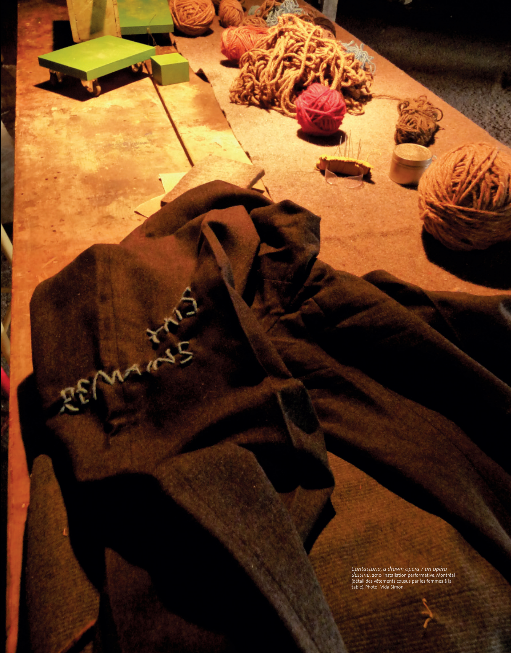
Cantastoria, a drawn opera / un opéra dessiné , 2010, installation performative, Montréal (détail des vêtements cousus par les femmes à la table).