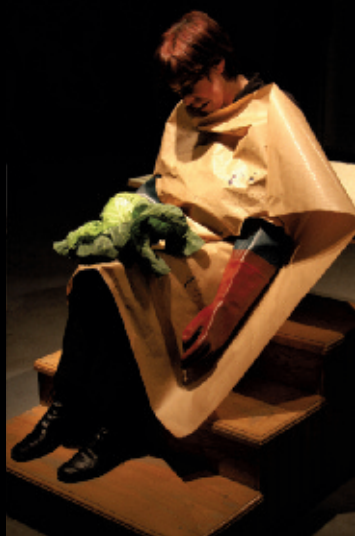
Choosing to keep or dispose , 2012, performance, Interakcje International Art Festival, Pologne.