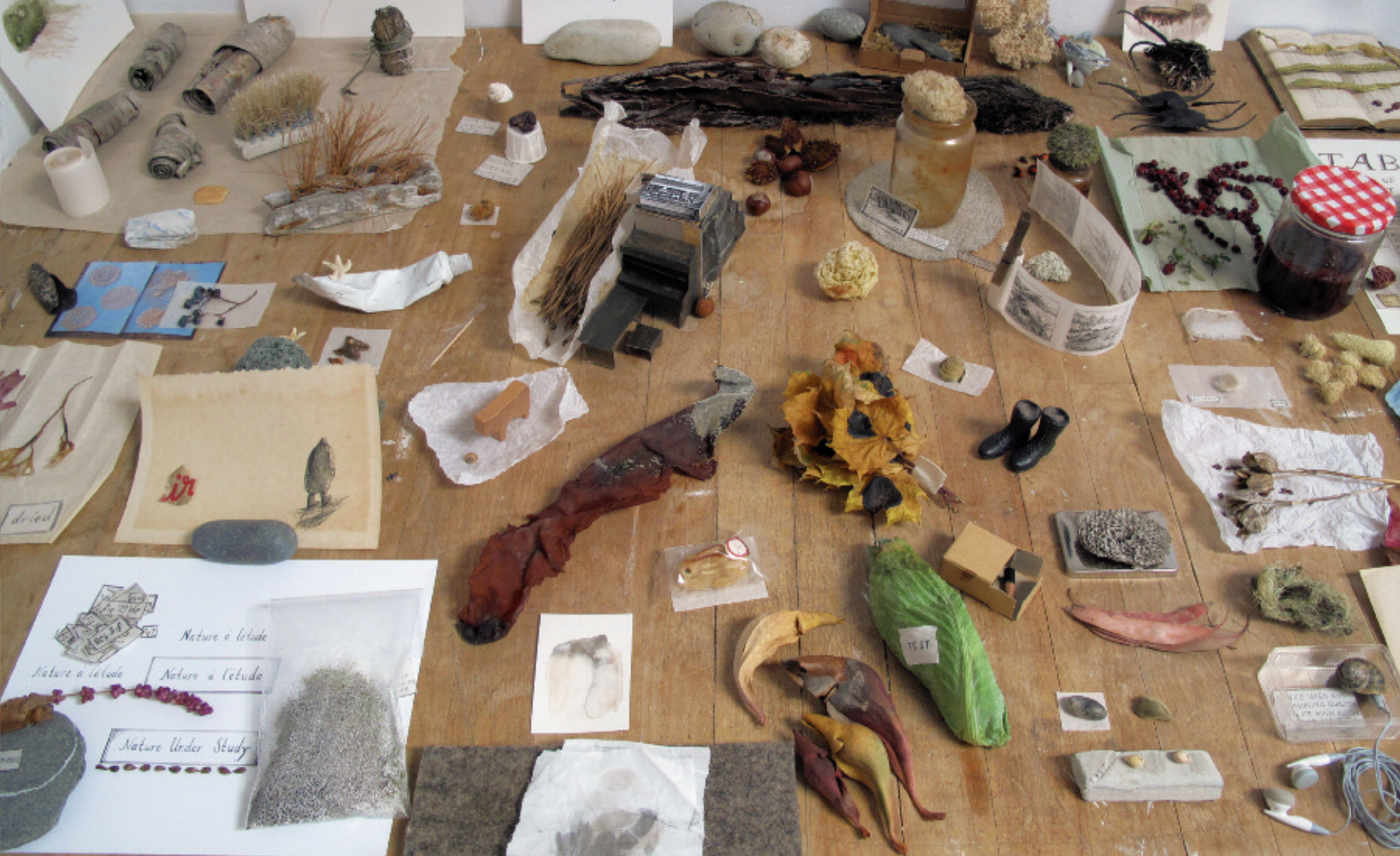
Elle marche. Blue Mountain, 2012, exposition performative, Oboro, Montréal (détail d'installation).