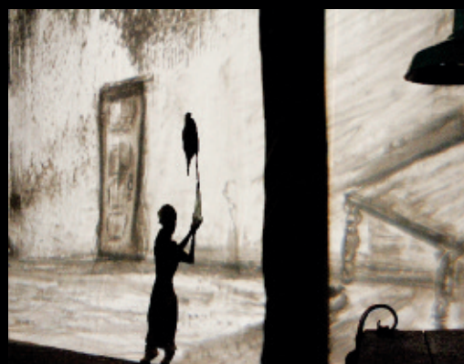
Cantastoria, a drawn opera / un opéra dessiné , 2010, installation performative, Montréal (détail de projection).