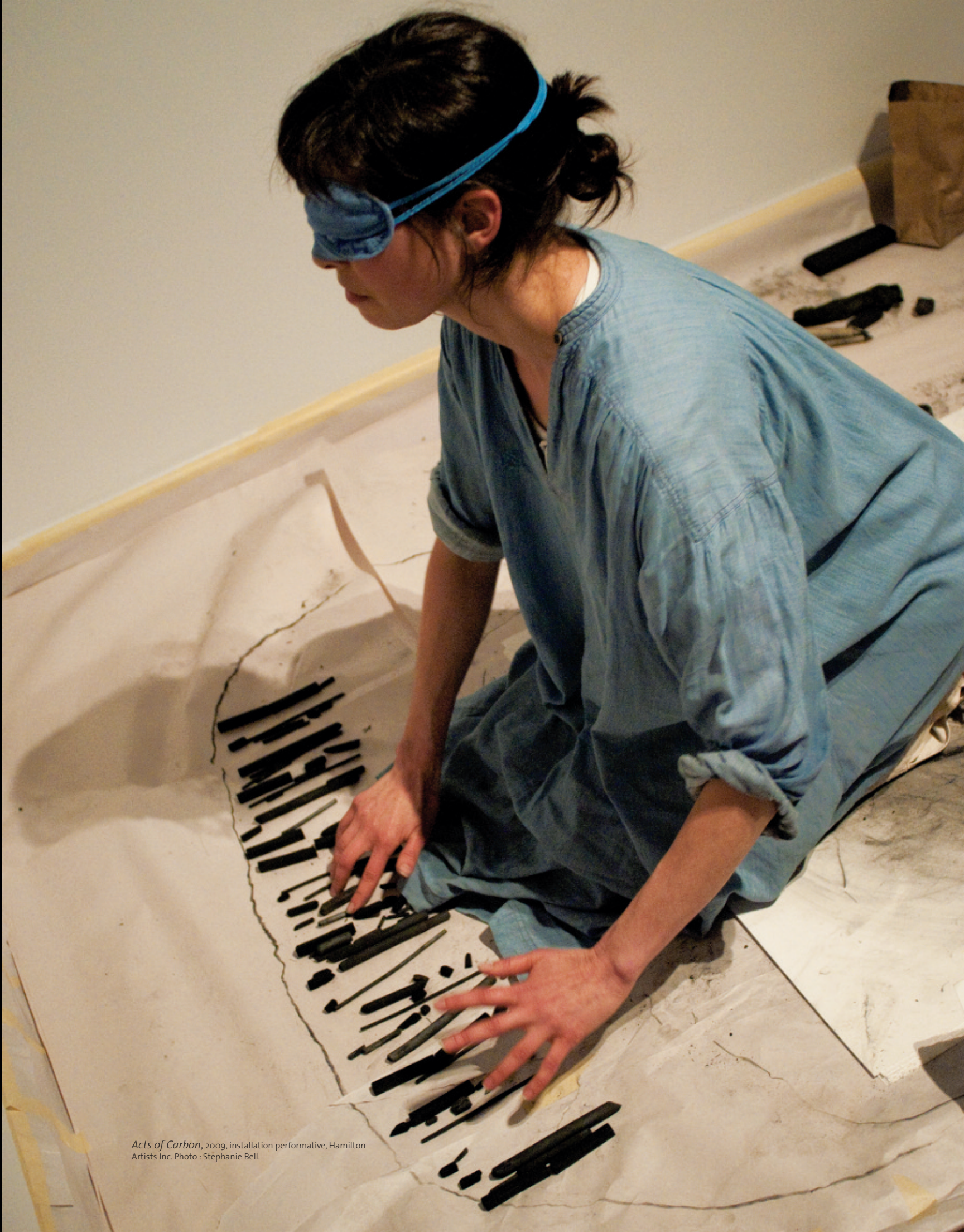
Acts of Carbon , 2009, installation performative, Hamilton Artists Inc.