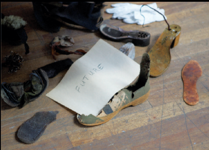
Elle marche. Blue Mountain , 2012, exposition performative, Oboro, Montréal (détail d'installation).