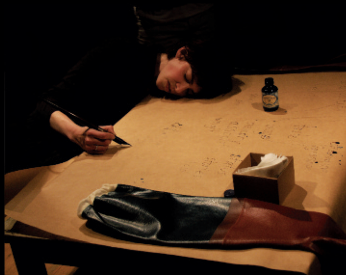
Choosing to keep or dispose , 2012, performance, Interakcje International Art Festival, Pologne.