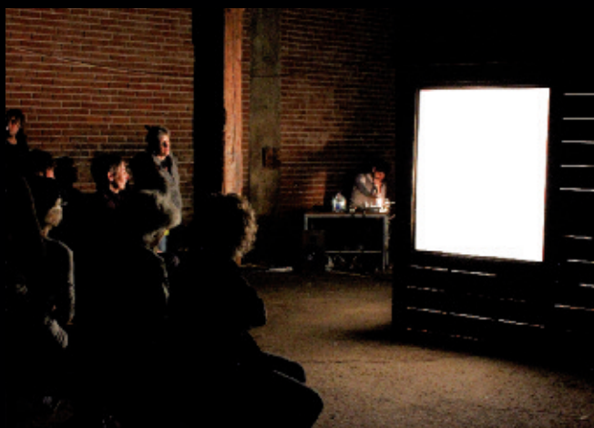
Cantastoria, a drawn opera / un opéra dessiné , 2010, installation performative, Montréal (vue de la boîte lumineuse).

Ce paysage-diamant, la commissaire Caroline Loncol Daigneault cherche à l'embrasser avec Elle marche. Blue Mountain , qui en révèle les souches en le ramifiant par une pratique curatoriale approchant l'œuvre de Vida Simon, son ouvrage et son exposition dans une même foulée, d'une manière empirique basée sur l'expérience commune et individuelle. Ce projet, déployé / présenté chez Oboro l'automne dernier, rassemble et révèle les mouvements et motifs en jeu dans le travail de Simon. Il en saisit les subtilités micro et macroscopiques, procurant une logique à ses écheveaux dynamiques, rassemblant cette pratique du complexe sous un même principe sans toutefois l'unifier, l'aplatir ou la figer. Le défi est de tailles .