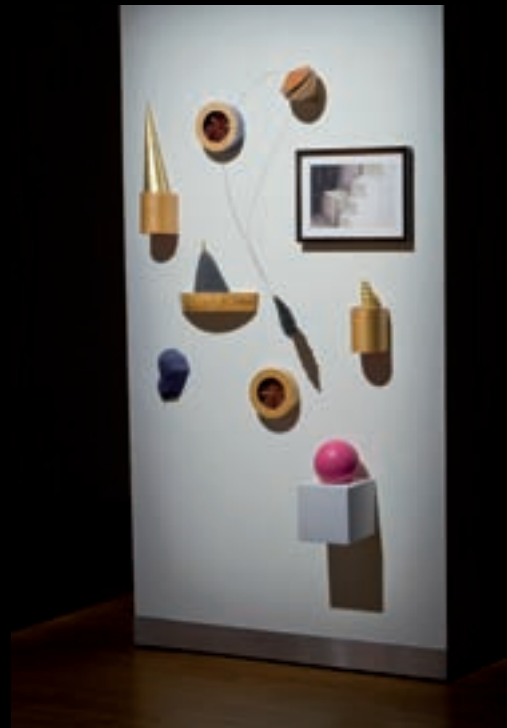
Démarche, 2003-2004 200 cm x 120 cm x 25 cm ; bois, fil de métal, polyuréthane, résine de coulage, résine de fibre de verre, poudre de carbure de silicium, silicone, feuilles d'or, peinture, sel, photographie (tirage à jet d'encre). Ne pas être, 2009 (droite de l'image - détail) Photographie: 70 cm x 50 cm; tirage à jet d'encre.