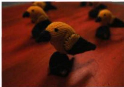
Leçon de chant , 2009, Installation

Du 16 octobre au 21 novembre 2009 Vernissage le 17 octobre à 14 h