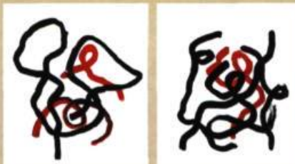
Serge Murphy Chemin 1, Chemin 2, 2009 Encre sur papier 56 x 56 cm

D'où vient l'idée du nom du centre? Comme le souligne Lili Michaud : « Le choix du terme « occurrence » visait à le définir comme un point de rencontre dans lequel s'inscrit une fréquence, un espace propice à la formation de discours où les contingences occuperaient cependant leur place. C'est l'esprit de ce mot ouvert et abstrait qui a guidé notre activité. Le hasard seul n'a pas conduit notre choix d'artistes invités à confronter leur travail, comme on pourrait le croire au premier abord. Parmi la centaine d'expositions et de créateurs présents à Occurrence depuis 1989, les possibilités étaient vastes et les dialogues nombreux. Selon nos champs d'intérêt, nous nous sommes tournés vers le dessin, la peinture et la sculpture et avons choisi de réunir des artistes dont le travail réfléchit sur ces pratiques souvent combinées sous une forme hybride dans le résultat final. » L'exposition destinée à marquer la 20 e saison est le reflet de cette orientation et en même temps l'expression d'une de ses réactualisations.