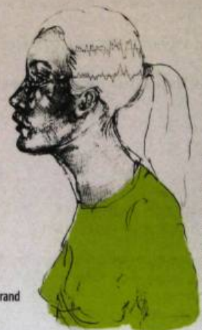
Separation Amiey, 2009