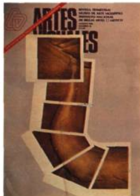
Artes Visuales, Mexico.