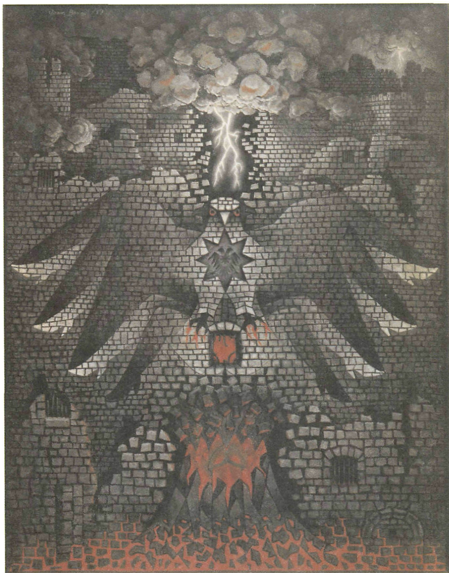
Jean Benoit, Hommage au marquis de Sade , 1959, matériaux divers, 71 x 56 cm. [Cette image était reproduite sur le carton d'invitation à la performance.]