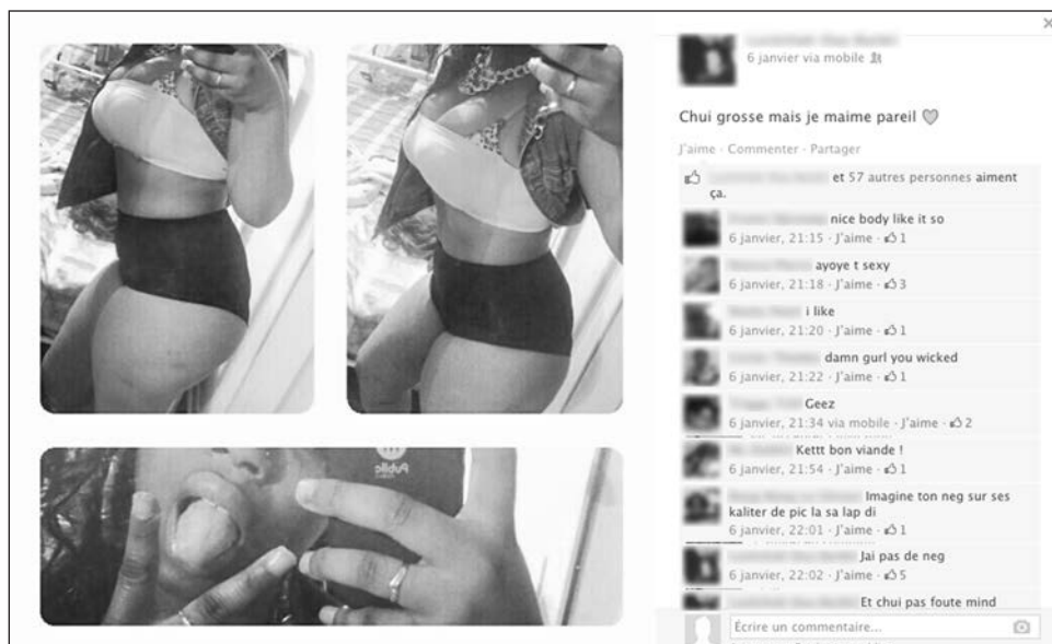
Figure 6: 194 Photo et commentaires