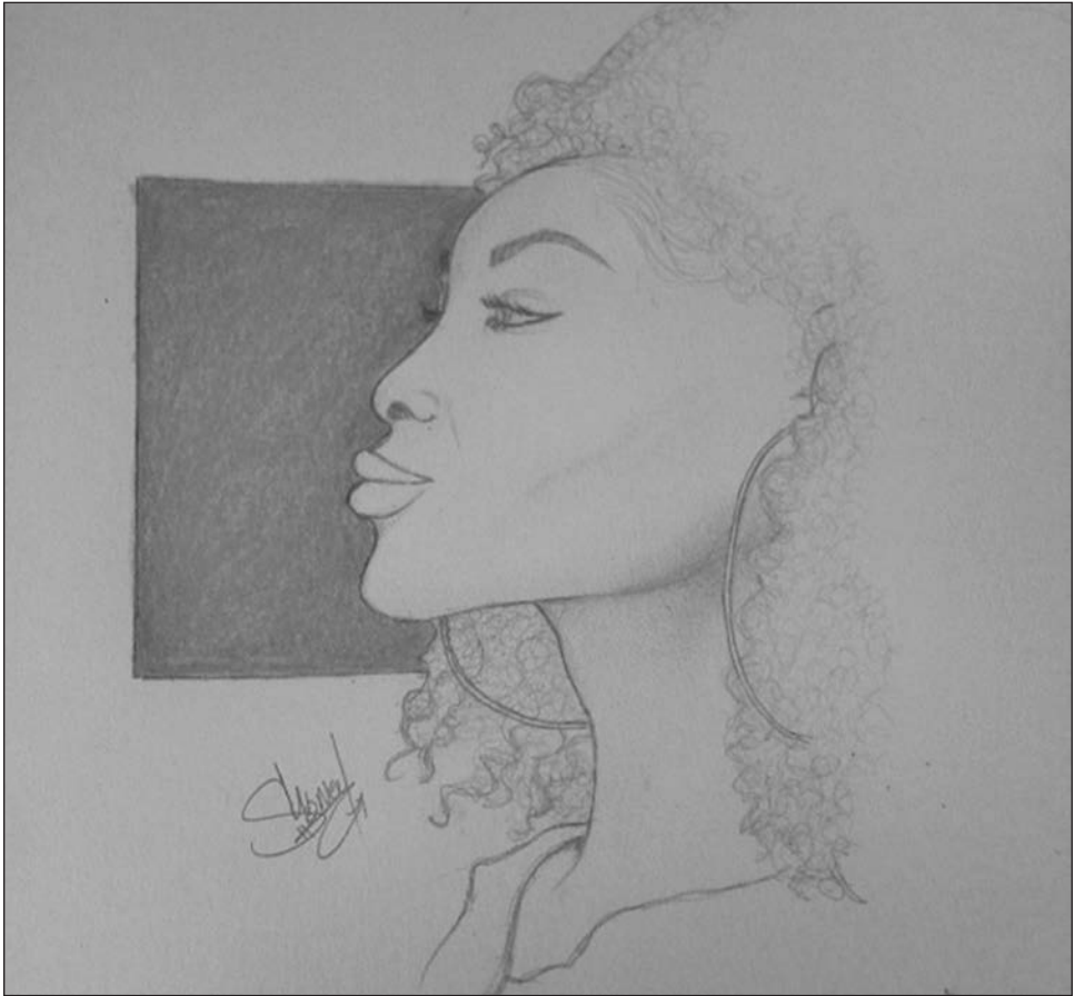
Figure 2: «Sketch», par Sydney A.

exemple, les femmes des tribus m'inspirent beaucoup», estime l'une d'entre elles 19 . Il s'agit de dessiner et de peindre des femmes fortes, fières, ayant confiance en elles où l'origine africaine et la dimension «afro» sont recherchées, revendiquées et assumées :