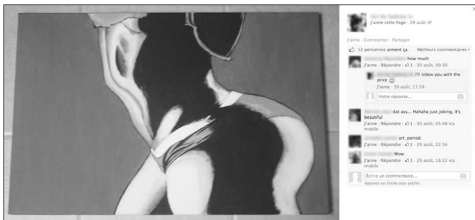
Figure 5: Nike+commentaires

Entrevue avec Julie, Montréal, juillet 2013