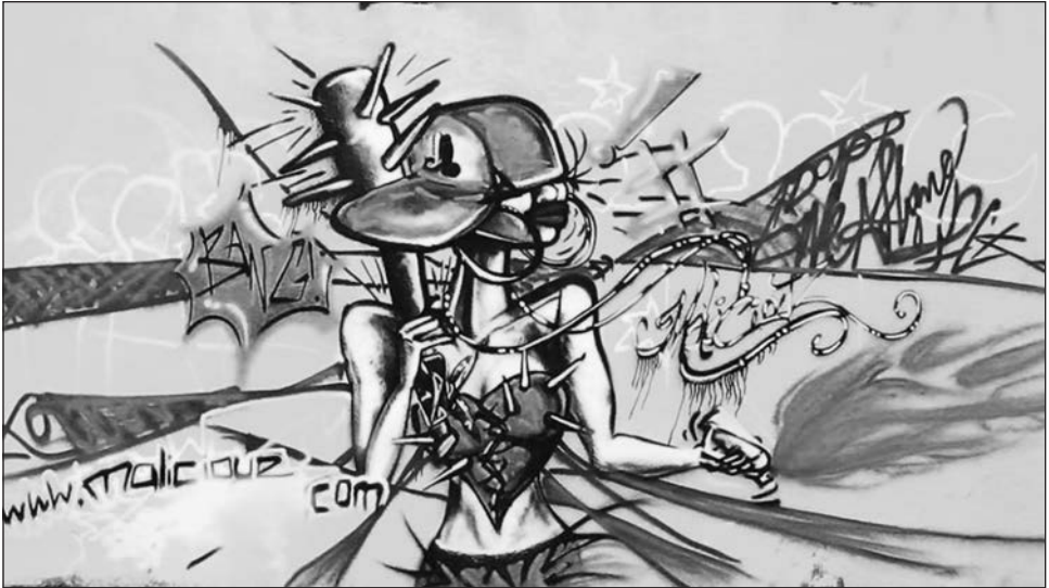
Figure 4: Graffiti 2013 20

Aux côtés de ces reines africaines «remixée[s] dans un style infusé d'une saveur de rue», pour reprendre l'expression d'une de ces artistes, se trouvent des princesses-gangster ou barbies-rebelles aux formes élancées et fines qui évoquent la poupée commercialisée par Mattel avec une autre couleur et d'autres accessoires. Ces princesses urbaines coiffées de casquettes sont prêtes au combat et arborent des battes de baseball dentelées de pique, un fouet ou encore des pistolets. Elles affichent de nombreux attributs présents chez les rappeurs nord-américains : cigare, champagne, lunettes de soleil, chaînes autour du cou, argent, logos de marque prestigieuse (Louis Vuitton et Chanel dans ce cas-ci). Des piercings au niveau des joues, des lèvres et les tatouages « princess », « proud », « live for oneself » sont également visibles. Leur attitude est selon les cas, hautaine ou provocatrice. Ces gangsters filles ou super-héroïnes évoluent dans un milieu urbain ou dans des décors luxueux inspirés de vidéoclips de rappeurs nord-américains (Lil Wayne, Kanye West, etc.). Le pendant photographique présente de nombreuses similitudes. Les egoportraits insistent sur des bagues, un fort maquillage, l'alcool, la cigarette et des décolletés emplis de dollars canadiens. Notons que plusieurs jeunes femmes réalisent aussi bien des reines africaines que des barbies-rebelles.