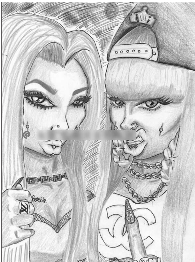
Figure 3 : Rebelle