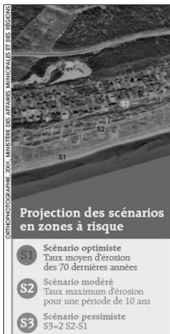
Figure 2: Modèle montrant les scénarios projetés des zones à risque 11