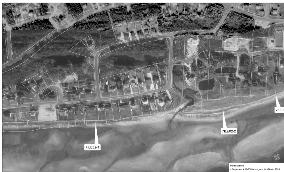
Figure 1: Règlement N° 02-2005, carte 185 10