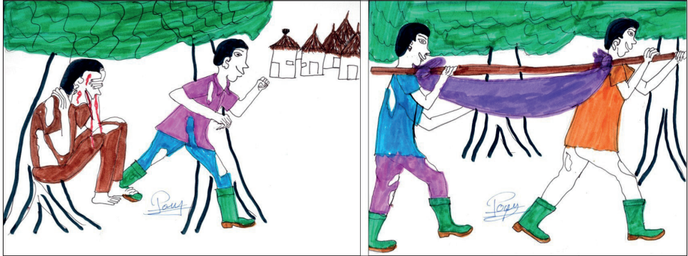
Fig. 4 — Dessins 7 et 8.

La peau de celui qui est contaminé éclate parfois, j'ai vu ça une fois, je ne me suis pas arrêté pour voir ça très longtemps. Cela se passait à la frontière. Des docteurs contrôlent la frontière. [Quoi qu'il en soit, l'homme qui saigne] ne parle plus beaucoup [et son compagnon] court pour appeler au secours [dans le Dessin 7].