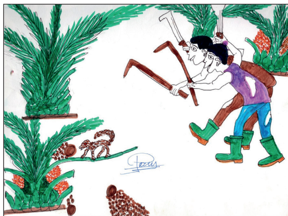
Fig. 1 — Dessin 1. Source : Diniaté Pooda (2018).