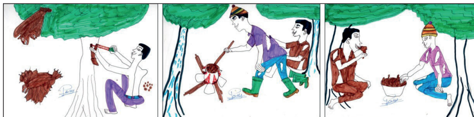
Fig. 3 — Dessins 4, 5 et 6.