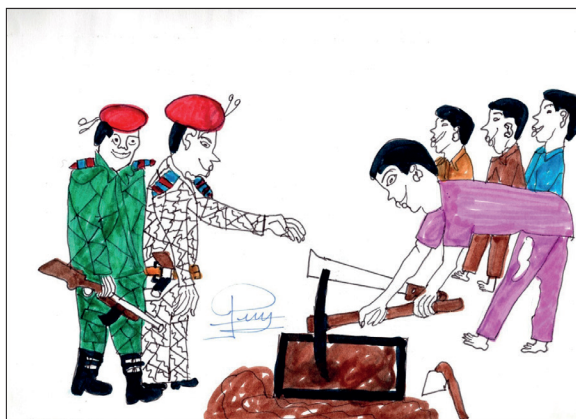
Fig. 6 — Dessin 11 .

Un mort d'Ebola, tu ne peux pas laisser deux heures de temps sans l'enterrer. Les Africains sont très compliqués, si un garde n'est pas derrière, on fait ce qu'on veut. Mais les corps habillés sont là : il ne faut pas que ça dépasse deux heures de temps et ils disent : « Creusez, creusez. » Ceux qui vont enterrer, il faut les gants, on prend des gants en caoutchouc noir, on plie pour que l'odeur ne sorte plus, il faut protéger, fermer les narines. On amène des caoutchoucs noirs et on descend dans la tombe et on rembourre et c'est fini. [L'un des gendarmes porte un uniforme blanc], c'est la nouvelle tenue d'Alassane, [celui qui est en vert arbore] une vieille tenue du temps d'Houphouët 6 , les corps habillés n'ont pas qu'une seule tenue. En Côte d'Ivoire, les gendarmes portent un béret rouge, c'est par les galons que tu vas savoir si c'est un gendarme ou un policier. Ce sont les gendarmes, en Côte d'Ivoire, si le village n'est pas grand, ce sont les gendarmes qui sont là, qui contrôlent tout.