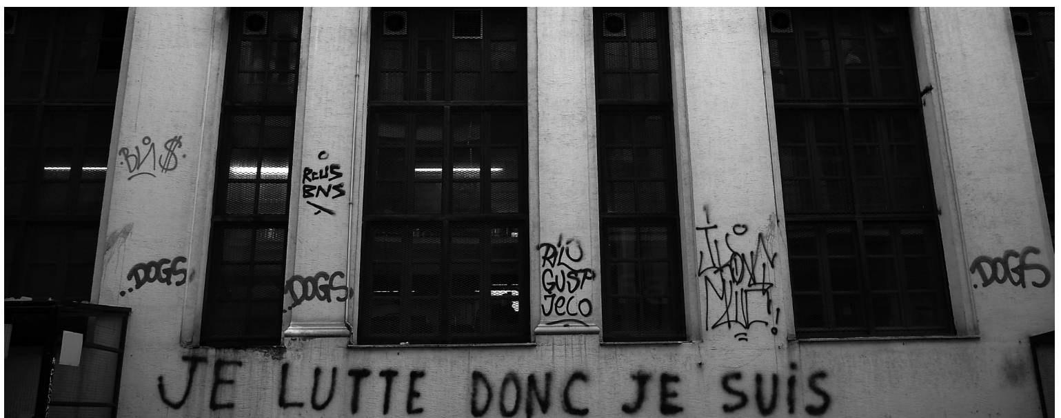
Titre du documentaire, sorti en 2015, Je lutte donc je suis de Yannis Youlountas, dans la rue Solomou, Exarcheia, Athènes.

Cela remet en cause l'un des principaux acquis issus de la révolte contre la dictature des colonels (1967-1974) qui avait notamment fait face à l'occupation de la Faculté de droit de l'Université polytechnique nationale par des étudiants en 1973 à Exarcheia. C'est dans ces lieux hautement symboliques qu'il y a 47 ans, des étudiants s'enferment et se barricadent pour mettre en place une radio clandestine qui génère un soulèvement généralisé. Des milliers de travailleuses et travailleurs, ouvrières et ouvriers, agricultrices et agriculteurs ainsi que des étudiant·e·s convergent vers le centre d'Athènes en dépit des charges violentes de la police. La manifestation du 16 novembre 1973 rassemble plus de