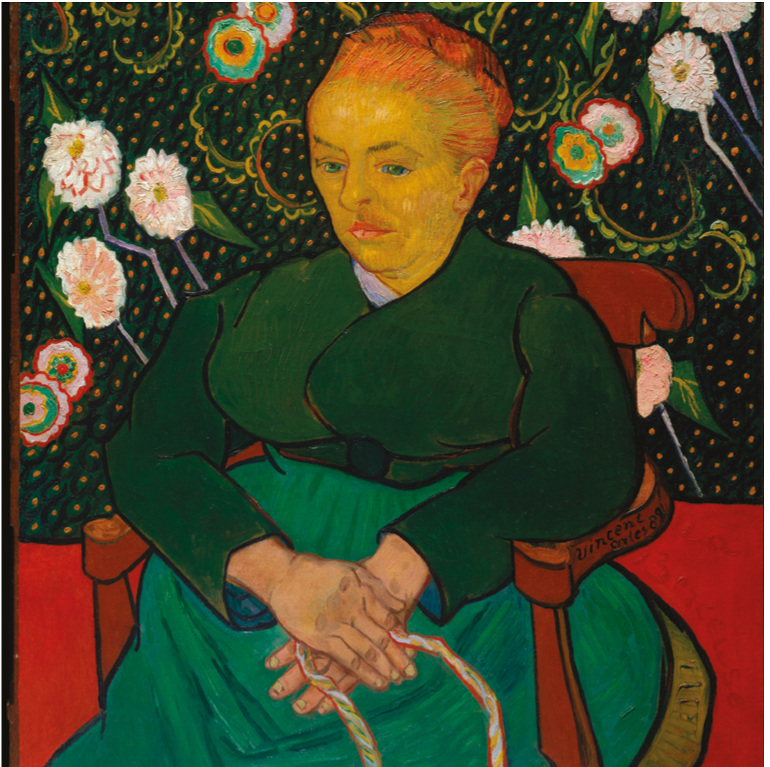
La Berceuse (Augustine-Alix Pellicot Roulin). Peinture : Vincent van Gogh, 1889.

1. Voir l'article de l'Appui pour les proches aidants : www.lappui.org/Actualites/Fil-d-actualites/2019/La-Technologie-au-service-des-aines-et-de-leurs-proches . Voir aussi l'article sur la sécurité et les objets connectés de l'organisme français TousEnTandem, qui favorise contre rémunération le pairage entre personne âgée et étudiant·e : tousentandem.com/les-objets-connectes-pour-les-seniors-danger-ou-opportunite .