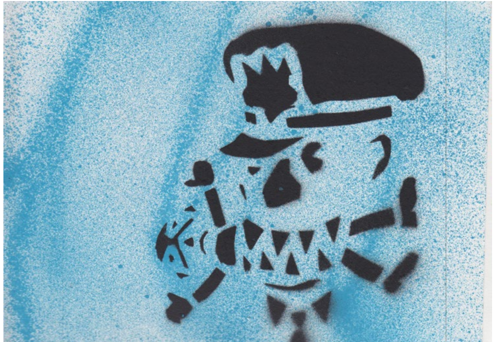
Boeuf. Pochoir: Ramon Vitesse.

Les forces policières font leur part pour déstabiliser les efforts des parents des jeunes noir·e·s et autochtones, et ce, dès un jeune âge. La police envoie un message clair à ces jeunes en les suivant dans la rue, en les tabassant, en leur demandant constamment leurs papiers, en rôdant dans leurs quartiers, en harcelant leur famille, sans égard pour leur dignité ni leur vie privée, sous prétexte de chercher un suspect ou d'assurer la sécurité. Le message passé à tou·te·s les Autochtones et Noir·e·s est que notre présence même dans l'espace public et dans la société pose problème.