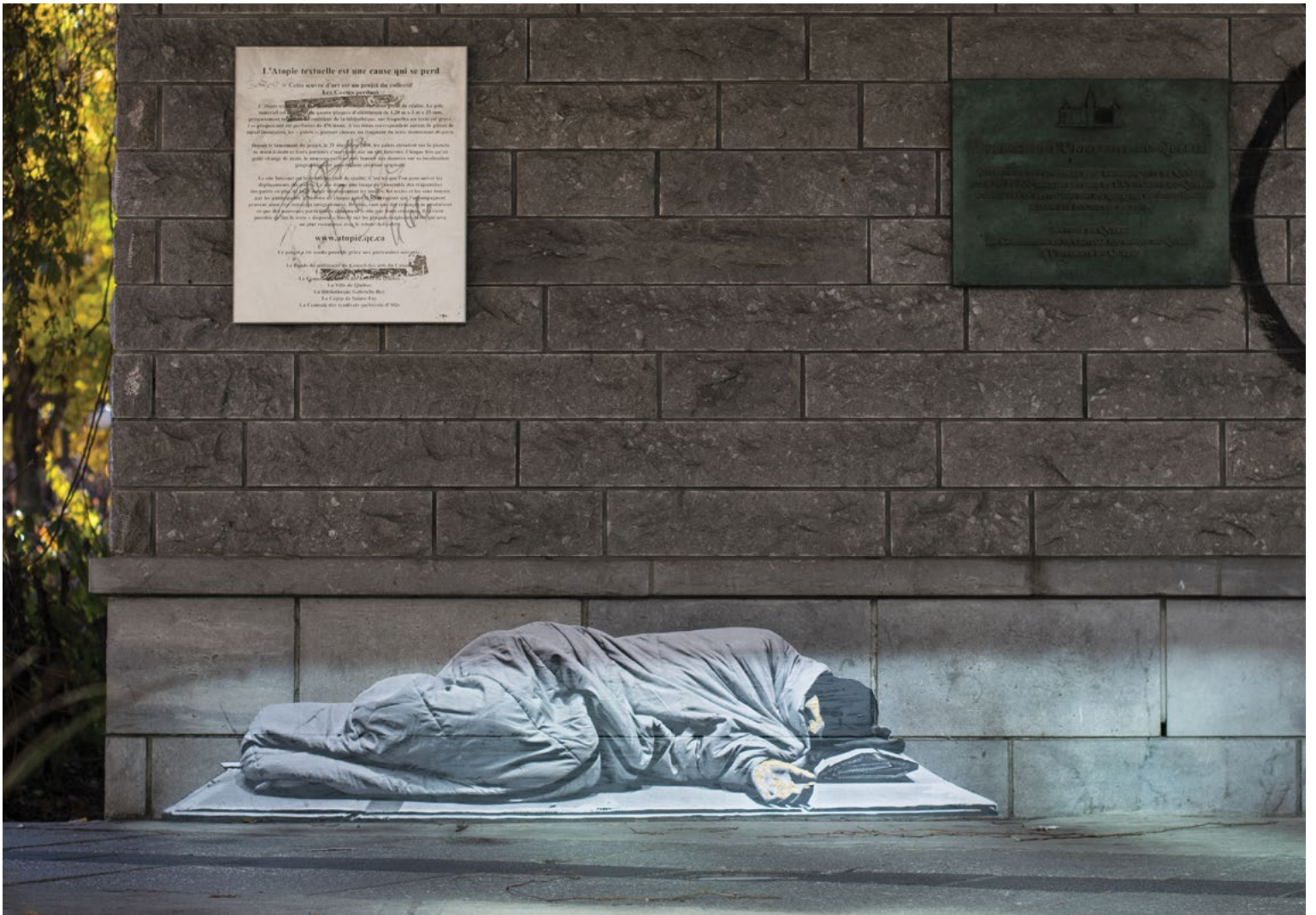
Graffiti sur la place de l'Université-du-Québec, Québec.