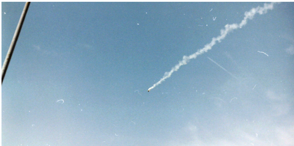
Manifestation à Québec le 21 avril 2001 lors de la 2 e journée du Sommet des Amériques.

Par la suite, certaines associations étudiantes, comme l'Association étudiante du