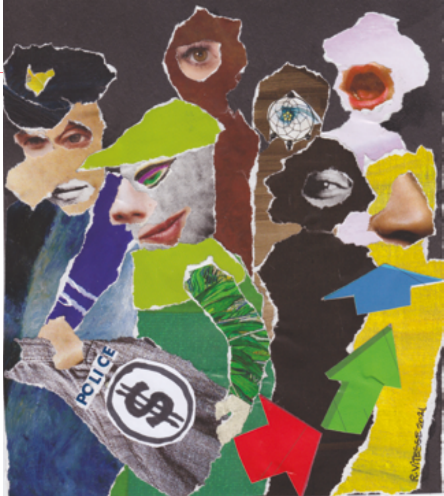
Illustration: Ramon Vitesse.

De plus, plusieurs activités et branches de la police ont comme objectif principal d'inculquer une perception positive de la police au sein du public. Les activités policières dans les écoles, où sont distribués des chapeaux de police et des livres à colorier avec des images de la police, en sont un exemple. Au fil du temps, la police a aussi pris en charge certains rôles particuliers dans le domaine des soins, ce qui a eu comme effet de dissocier le travail de la police de la répression. À ce titre, on note par exemple l'inspection des conditions de logements locatifs et le travail dans les soupes populaires au XIX e siècle et, aujourd'hui, les vérifications sur l'état de