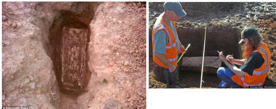
Fig. 4. Mise au jour d'un cercueil d'enfant en plomb daté des III e ou IV e siècle dans le Leicestershire, et intervention des archéologues de Archaeology Warwickshire

Enfin, dans une étude récente (2017), un chercheur britannique, Samuel Hardy, a tenté d'estimer le nombre des utilisateurs de détecteurs et d'objets découverts par an dans plusieurs pays, aux législations restrictives ou permissives [35]. Il en arrive à la conclusion que la mise en place d'une législation restrictive permet de contenir la perte d'informations, tandis qu' contrario une législation permissive semble avoir tendance à créer une sorte d'appel d'air pour les détectoristes, pas forcément suivie d'effets en termes de déclarations de trouvailles archéologiques. Selon lui, 96 % des objets découverts ne sont pas répertoriés par le PAS ... Ainsi, plutôt que d'adopter une attitude fataliste face à la menace que représente la détection de métaux sur le patrimoine archéologique, il revient à l'archéologue de s'interroger sur sa place dans le processus de légitimation des actions des détectoristes. Ne faudrait-il pas s'astreindre à un code de déontologie, tel qu'il existe pour les musées [36]?