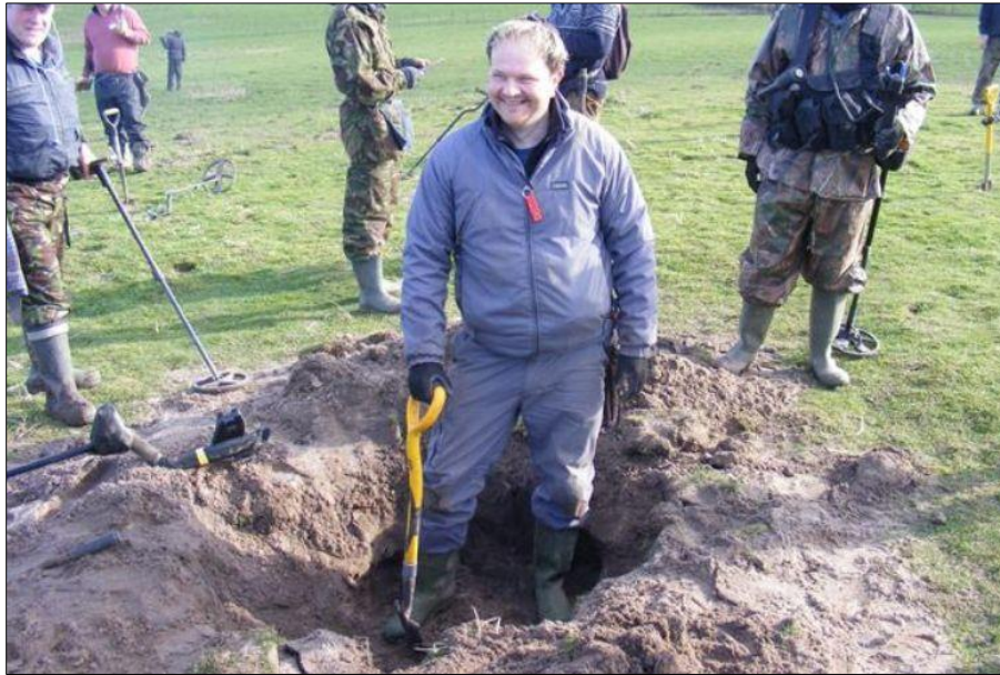
Fig. 3. Mise au jour par un détectoriste d'un dépôt anglo-saxon du VI e siècle