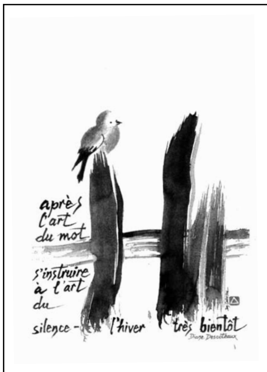
HAÏGA : HAÏKU DE DIANE DESCÔTEAUX CALLIGRAPHIÉ SUR UNE AQUARELLE DE L'ARTISTE ROUMAIN ION CODRESCU.