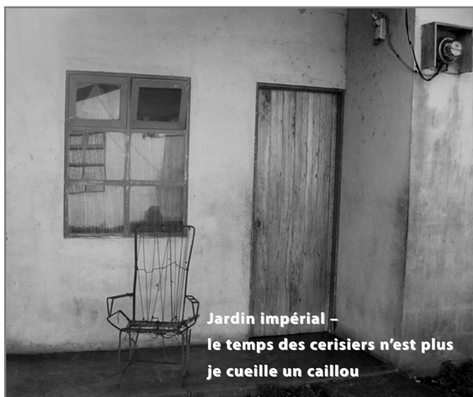
HAÏSHA : HAÏKU DE JANICK BELLEAU ET PHOTOGRAPHIE DE DANIELLE SHELTON – COSTA RICA 2006