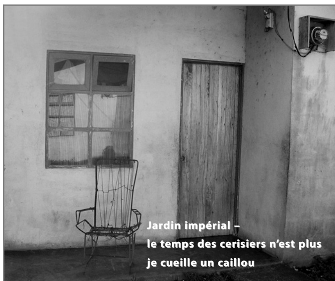
HAÏSHA : HAÏKU DE JANICK BELLEAU ET PHOTOGRAPHIE DE DANIELLE SHELTON – COSTA RICA 2006