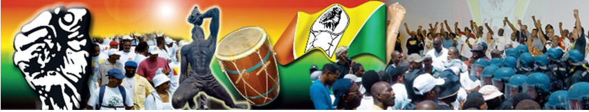
Figure 2 : Drapeau du syndicat UGTG (Union Générale des Travailleurs de Guadeloupe).