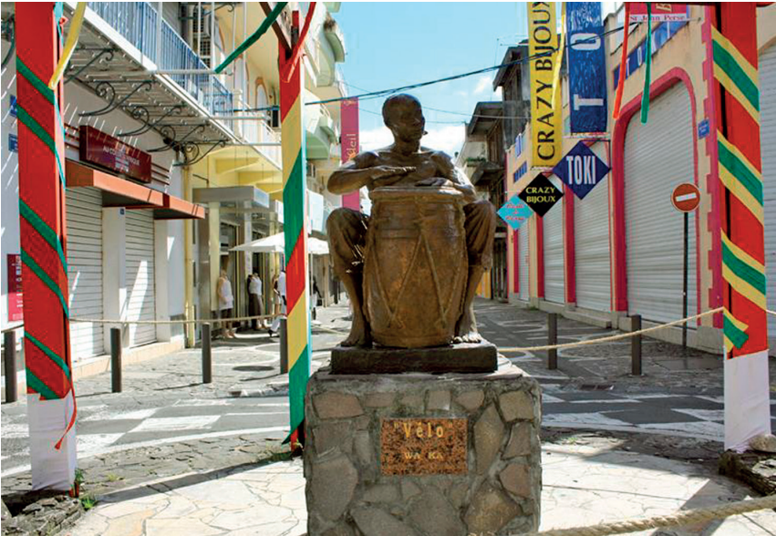
Figure 3 : Statue de « Vélo », Pointe-à-Pitre.