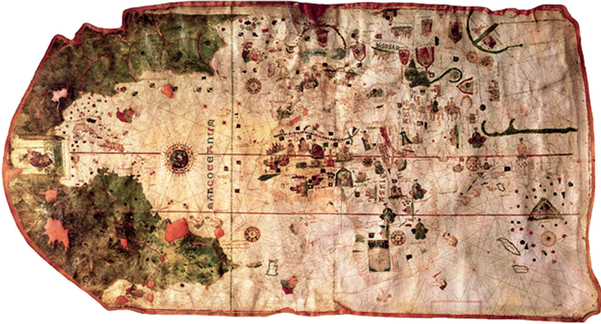
Fig. 5 – Carte de Juan de la Cosa, 1500

au duc de Lorraine par le roi du Portugal après le départ de Vespucci pour l'Espagne en 1505 (ce qu'avance Albert Ronsin, et idée que partage Mme Pelletier), serait accompagné d'une carte marine portugaise utilisée dès lors par Waldseemüller lors de l'élaboration de sa mappemonde de 1507. Toujours pour le même auteur, Waldseemüller se serait bel et bien « inspiré » de la carte de Marcellus, cartographe d'origine allemande travaillant alors à Florence. Ladite carte, conservée à l'université de Yale, est graduée en latitude et longitude (Fig. 6). Elle a été élaborée aux alentours de 1490, et utilise la projection « pseudo-cordiforme » reprise par le cosmographe de Saint-Dié dans son planisphère de 1507.