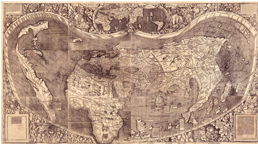
Fig. 2 – Planisphère de Waldseemüller, 1507