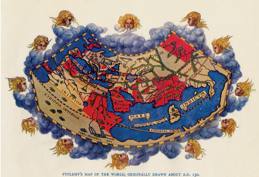
Fig. 9 – Carte de Ptolémée (dessinée vers 1465)

Brotton donne aussi quelques définitions du mot « découverte », sa traduction (et le sens qui s’y rattache), en différentes langues – définitions et sens qui corroborent ce que j’écris à ce propos. Il rapporte aussi comment la Castille, opposée à Jean II du Portugal et à Charles Quint à propos des Moluques et de leur monopole commercial dans la région, se servit du terme pour tenter de faire valoir son bon droit – en pure perte. Le même auteur discute, entre autres, de la date de publication du planisphère de Waldseemüller, laquelle serait postérieure à 1507 d’après analyses de tels experts, ce qui reste à démontrer.