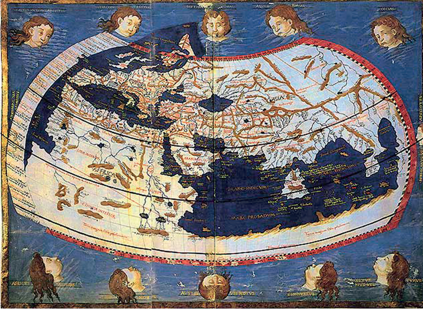
Fig. 6 – carte de Marcellus, 1490.

Une telle hypothèse nous semble l'explication la plus plausible, car nul ne peut défier impunément l'autorité du pape à cette époque, surtout pour un catholique et chanoine de surcroît !