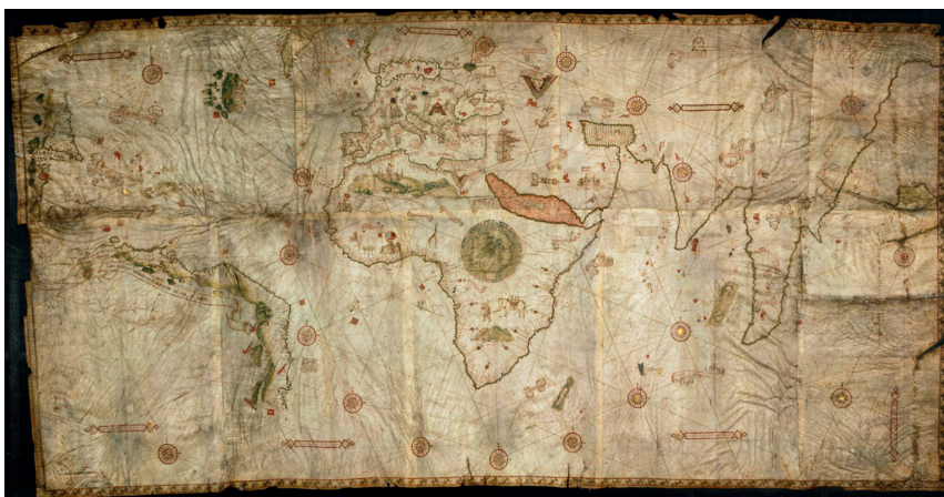
Fig. 3 – Carte de Caverio, 1504/1505

et fig. 2, planisphère) ! En effet, courant 1513 – il récidivera en 1516 avec une carte « dressée à la façon des portulans...et pratiquement identique à celle de Caverio » (Fig. 3), avance Léon Gallois en 1904 –, le cartographe de Saint-Dié élabore une nouvelle carte – la Tabula Terre Nove –, de taille moindre que la précédente (fig. 4), qui montre, outre un fragment des côtes européennes et africaines, les Antilles, et une partie des côtes américaines jusqu'au sud du Tropique du Capricorne. Cuba y est nommée « Isabella » et Hispaniola « Spagnolla ». Au-dessus de la mention « TERRA INCOGNITA », il est écrit en latin, en petits caractères et sous la ligne équinoxiale, « Cette terre et les îles adjacentes ont été découvertes par Colomb mandaté par le roi de Castille ».