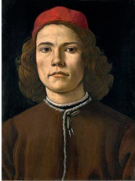
Fig. 8 – portrait d'un jeune garçon (Amerigo Vespucci ?) de la National Gallery

dressé, ne serait-ce qu'un croquis, de ces terres nouvelles – notamment la Terre Ferme, laquelle ne peut être Cuba comme le prétendent de rares auteurs – dont il fut le découvreur ? Car tout ce que l'on tient de lui n'est qu'une vague esquisse de la côte nord d'Hispaniola. Cependant, Las Casas, à qui l'on doit tant quant aux voyages de Colomb et à sa découverte des « Indes », précise qu'une « peinture » des régions continentales découvertes par l'Amiral avait été envoyée aux Rois Catholiques, avec son journal de bord du premier voyage. Le tout n'ayant jamais été retrouvé, bien entendu, ce qui est fort dommage et qui eût permis de prendre connaissance des passages « occultés » (l'expression est de Varela, qui assure que « la véracité » du Dominicain est « absolue ») par Las Casas dans son « Histoire générale des Indes ». Car ce dernier avait eu l'opportunité de consulter le fameux journal de bord, ou la copie de l'original remise par la Corte à la famille Colomb, avant sa disparition. Quant à la missive que le Navigateur rédigea à l'intention des souverains d'Espagne en 1493, missive scellée dans un baril jeté à la mer avec une copie dudit journal de bord, et cela à l'occasion d'une terrible tempête à laquelle Colomb se trouva confrontée sur le chemin du retour, nul n'en a jamais eu connaissance – et pour cause ! Par ailleurs, Las Casas souligne que si l'Amiral avait bien « aperçu » la Terre Ferme le 1 er août 1498, il y débarqua le 5 août et la nomma « l'Île Sainte » !