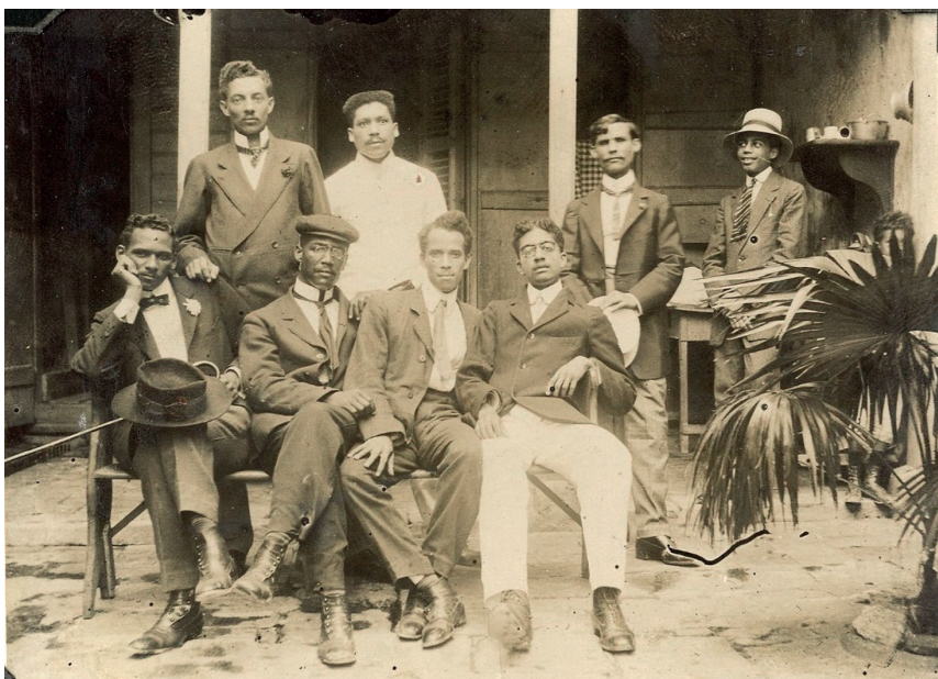
Avec les amis dans la cour intérieure.