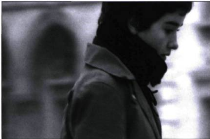
Le kino Le Pingouin et la mer de Dominique Laurence

Production et diffusion du court métrage au Québec