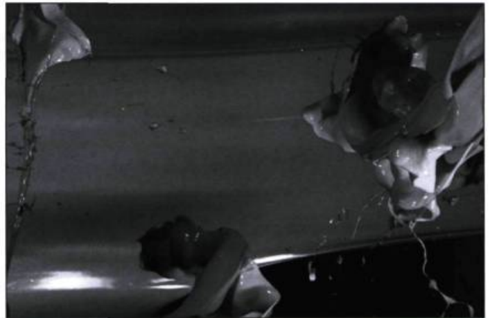
Le célèbre Oïo de Simon Goulet

Dans la continuité de la tradition d'improvisation qui a cours dans les secteurs de la musique et du théâtre, on tourne au Québec des films instantanés, façon 48 heures, productions événementielles à base d'inventivité et d'adrénaline. Regard sur le court métrage au Saguenay a fait de ces courses contre la montre, caméra à l'épaule, une spécialité. Chaque année, un jeune cinéaste accepte d'y tourner et d'y monter un film en deux jours, qui plus est en respectant des contraintes fixées par le public : un lieu, le trait de caractère d'un personnage, un accessoire, une réplique. Cela donne des films généralement divertissants, à consommer de préférence sur place. De son côté, Kino a mis en place les populaires Kino Kabarets : des créateurs de divers horizons produisent et diffusent à la chaîne des films en tous genres en marge d'un festival. Née à Montréal, la formule a notamment été reprise à Bruxelles, à Saint-