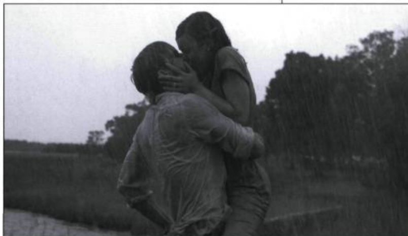
Une scène du film The Notebook ou quand la réalité rejoint la fiction...