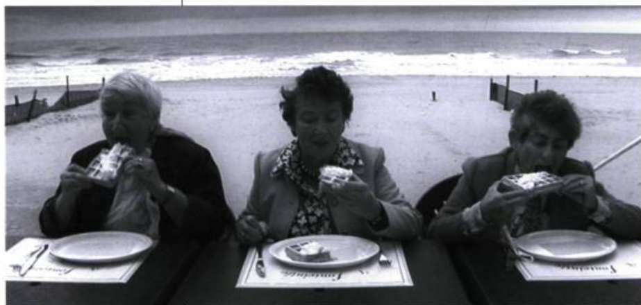
Alice et moi de Micha Wald

Greengrass, suite de The Bourne Identity , programmé sur la Piazza Grande. Quant au reste, force est de constater que bien peu des films du cru 2004 de Locarno sortiront en salles au Québec ou seront même au menu d'un des festivals nationaux. Il y avait bien Samsara de Nali Pan sorti en août à Montréal. Et on peut supposer que l'on verra tôt ou tard le plus récent Volker Schlöndorff, La Neuvième Porte , et encore Dogora , ce film atypique que Patrice Leconte a tourné, au Cambodge, sur une musique d'Étienne Perruchon. Quoi d'autre? À sa façon, certains jours la planète cinéma paraît immense. ■