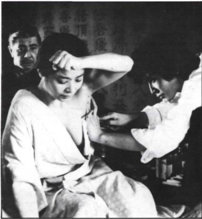
La femme tatouée.

costumes (l'héroïne, en kimono, fait la navette entre Tokyo et Kyoto en Shinkansen, train à très grande vitesse), le langage qui nous apparaît saccadé, violent? Oui, mais il y a plus important et qui touche aux films japonais en tant que produits culturels. Ce sentiment que les films, tant dans leur contenu que dans leur traitement, sont réglés comme une horlogerie, que tout mouvement, tout cadrage, tout geste, sont dessinés d'avance telles les phases d'un rituel ou d'une chorégraphie — ce sentiment, on l'a aussi, bien que dans une moindre mesure, au visionnement de La femme tatouée . De façon générale, il provient d'un surdétermination, d'une imbrication de plusieurs "arts" ancestraux dont les frontières mêmes semblent s'effacer; la fabrication de parasols y voisine la calligraphie, l'entretien de jardins va de pair avec les arts martiaux et le rituel du suicide, et le cinéma emprunte au "théâtre" et aux autres arts, et parle des autres arts.