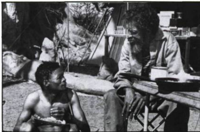
Un succès africain, Les Dieux sont tombés sur la tête .

Et encore, la liste n'est pas exhaustive. Au programme du F.F.M. il y avait également Caméra d'Afrique de Férid Boughedir (un tour d'horizon du cinéma africain contemporain), L'enfant secret de