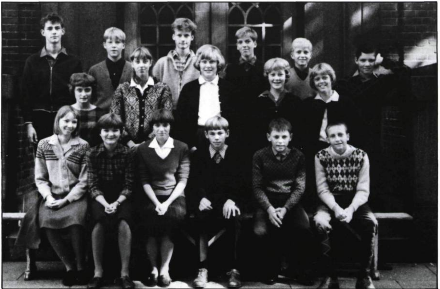
La traditionnelle photo de fin d'année.

En bon film scandinave, L'arbre de la connaissance présente une jeunesse belle, blonde et en santé évoluant en milieu favorisé. Rien à voir avec les adolescents débiles et dénués d'intérêt de Porky's (I et II) ou des Sous-doués (I et II). Pas encore la richesse, la profondeur et la qualité d'émotions des personnages des Zigzags d'André Melançon ou de Diabolo menthe de Diane Kurys.