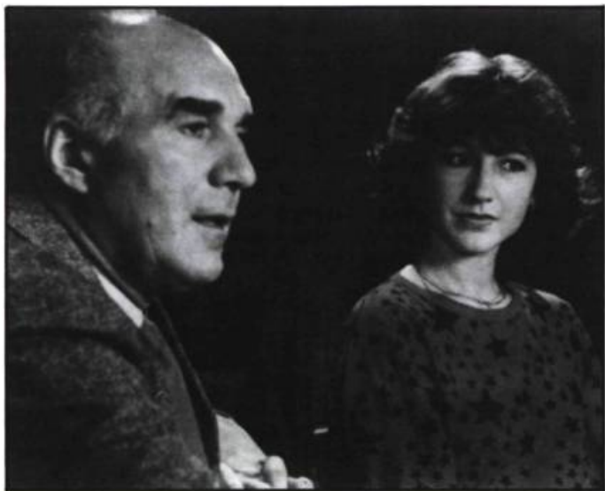
Le choix de Coline: son patron ou sa femme.