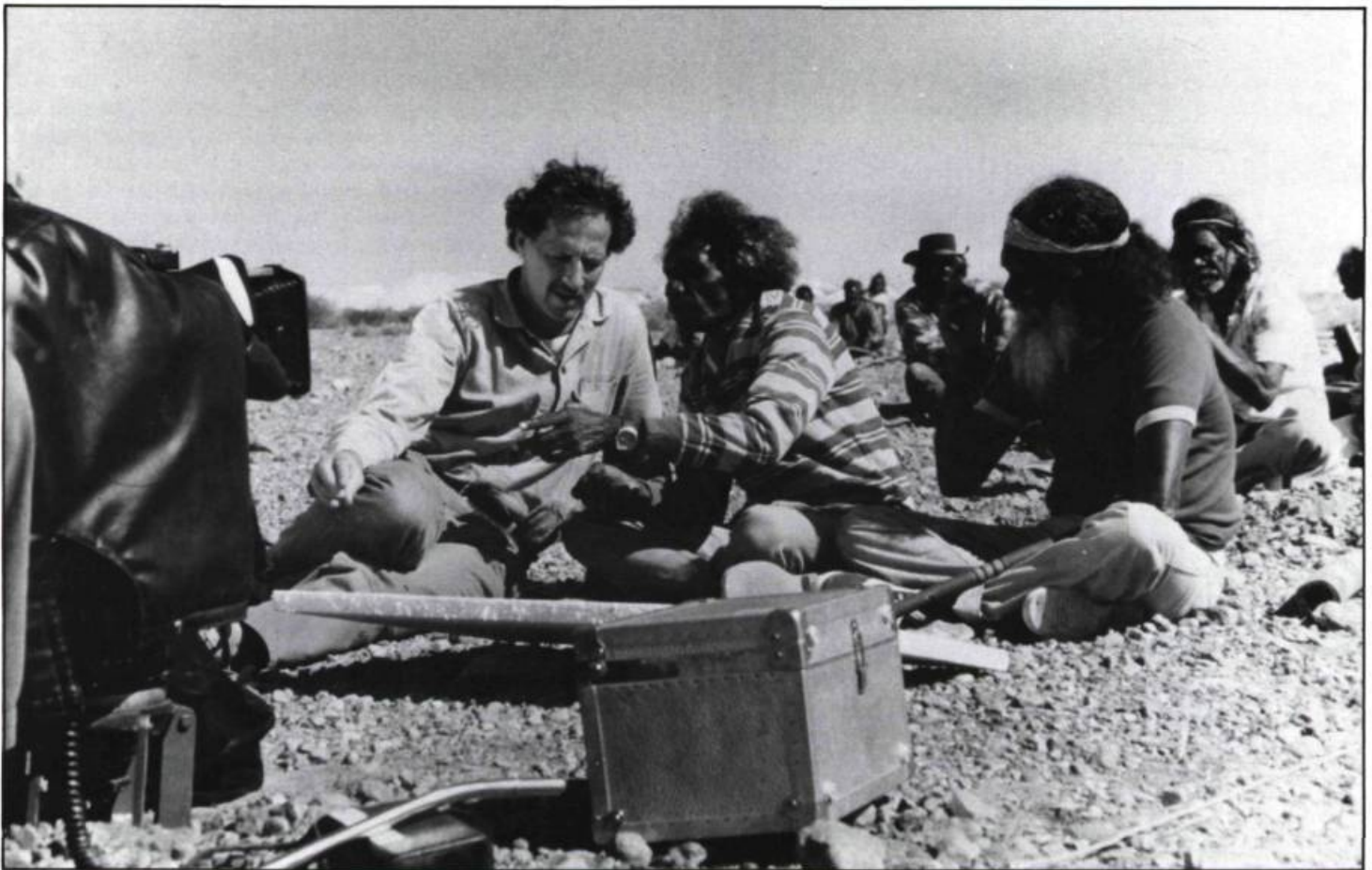
Le pays où rêvent les fourmis vertes de Werner Herzog (distributeur: Vivafilm).

Le projet est mené rondement: demandes de subventions, recherche d'appuis, fréquents voyages à Montréal. Le slogan retenu pour la promotion de ce premier festival non compétitif de Rouyn en dit long sur l'effet recherché et sur les résultats obtenus: «On aura tout vu». À l'automne 1982 on aura notamment vu, au théâtre du Cuivre, le ministre des Affaires culturelles, Clément Richard, inaugurer l'événement, des journalistes de la presse nationale couvrir le festival et se voir offrir une visite en avion des installations de LG2, et deux films très attendus, véritables locomotives du festival, Fitzcarraldo de Werner Herzog et Maman à 100 ans de Carlos Saura, présentés en première canadienne. Pas si mal pour une région où on avait pris l'habitude de voir les films avec plusieurs mois de retard sur Montréal. trois mille spectateurs participent au festival.