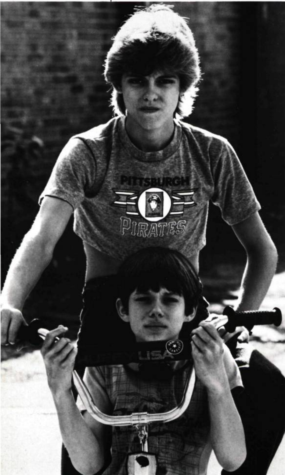
The Kid Brother

9. Aimez-vous les festivals de cinéma ? J'ai peu d'expérience des festivals, Montréal est mon second, mais je ne crois pas que je fréquenterai beaucoup les festivals. Je crois qu'on y rencontre toujours les mêmes gens. Et c'est beaucoup de temps perdu pour le travail.