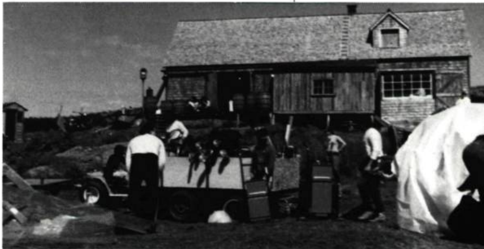
Les décors des Fous de Bassan