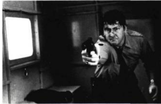
Le fourgon de Pouvoir intime

« Le théâtre triche beaucoup avec la réalité. Ce n'est pas d'ailleurs sa fonction de l'illustrer. Au cinéma, il y a une subtilité dans tout ce que l'on fait, des raisons secrètes qui déterminent le moindre choix. Il ne faut pas que le décor dérange le