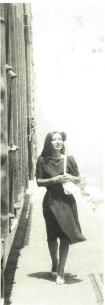
Danzon de Maria Novaro

Par contraste, le deuxième long métrage de Maria Novaro, Danzon , apparaît comme un hymne à la joie et un véritable rayon de soleil. Julia (Maria Rojo), femme dans la quarantaine, romantique et un peu infantile, part à Veracruz à la recherche de son partenaire de danzon, Carmelo, beau métis dans la cinquantaine, portant chapeau et souliers blancs. Belle histoire d'amour, Danzon est en fait beaucoup