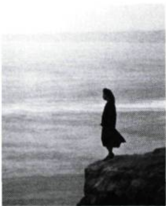
Tombés du ciel de Francisco Lombardi