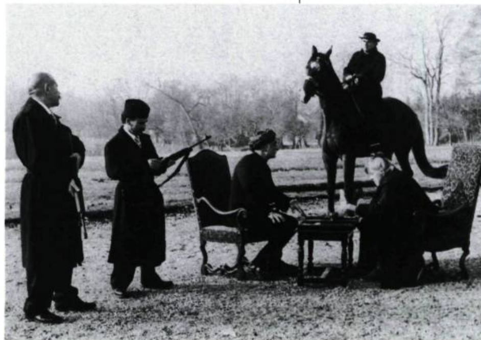
La Chasse aux papillons

«Ce film ( la Chasse aux papillons ) exprime le sentiment d'une perte irréparable; il tente de faire vivre sans drame et plutôt avec le sourire ce moment de rupture.» (Otar Iosseliani)