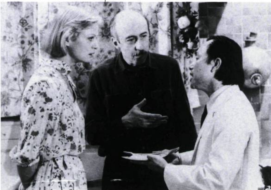
Les Favoris de la lune

Les gens dits normaux, au contraire, qui vivent leur vie sérieusement, ont la gentillesse de s'amuser pour que vous fassiez votre film. Par contre, ils refusent de faire, ou ils sont incapables de faire ce qu'ils ressentent comme faux; ils vous opposent les limites du naturel.