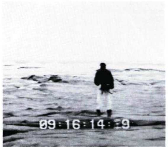
Le Testament du jeune marin

Au moment d'écrire ces lignes, je ne suis toujours pas certain que cette histoire existe — car je suis en cours de montage, et c'est vraiment là que le flot anarchique des images et des sons devient film ou vidéo — ou rien du tout. Ce que je sais pour l'instant, c'est que tout faire soi-même ou presque, quand on n'a qu'une habitude très moyenne de ce genre de machines, c'est de la grande aventure, pour ne pas dire de la folie pure. Le mythe de l'homme à la