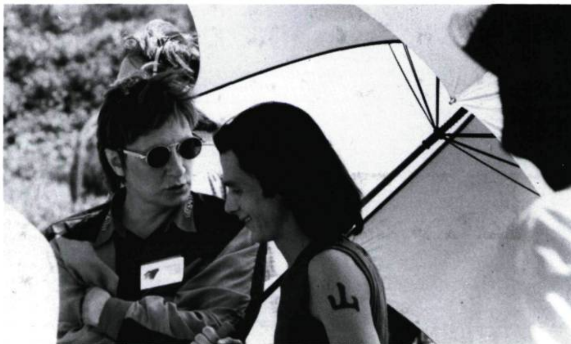
Lothaire Bluteau et Robert Lepage