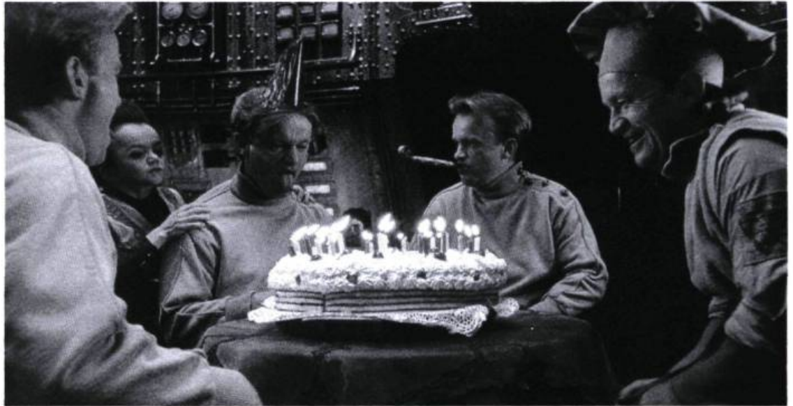
Les «clones» de Dominique Pinon, la Cité des enfants perdus

futée et un costaud au grand cœur qui cherche son petit frère kidnappé. Un pareil récit fantaisiste consent au plus extravagant des traitements. Pas question pour Jeunet et Caro de s'en priver. Tout est en décor de studio (un plateau de 4000 m 2 ), en effets spéciaux et en images de synthèse. On trouve dans ce film pas moins de 17 minutes de truquage qui ont nécessité plus de 5000 heures de calculs, 5000 gigaoctets manipulés ainsi que 40 000 images numérisées. Du jamais vu. Et le résultat est convaincant.