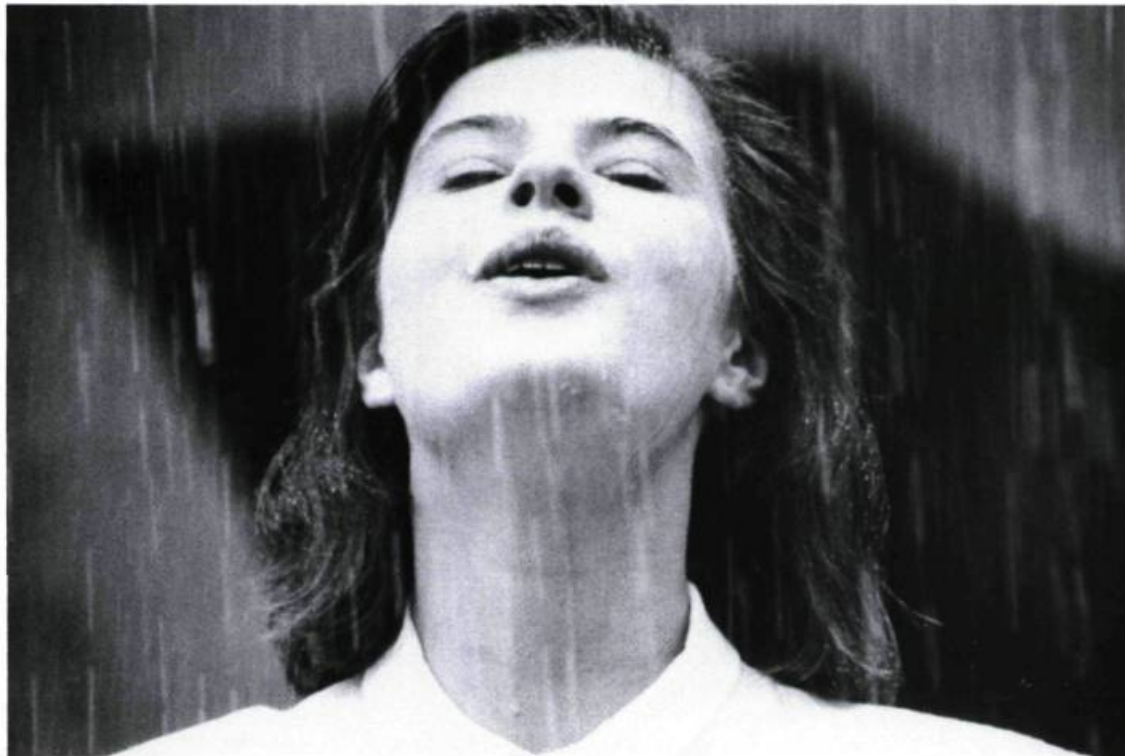
Irène Jacob dans la Double Vie de Véronique de Krzysztof Kieslowski

Mais c'est dans le Décalogue (1988-1989), sa série de dix films d'une heure pour la télévision basée sur chacun des dix commandements, et dont ont été tirés deux longs métrages pour l'exploitation en salle, Tu ne tueras point et Film bref sur l'amour (épisodes 5 et 6), que l'on peut vrai-