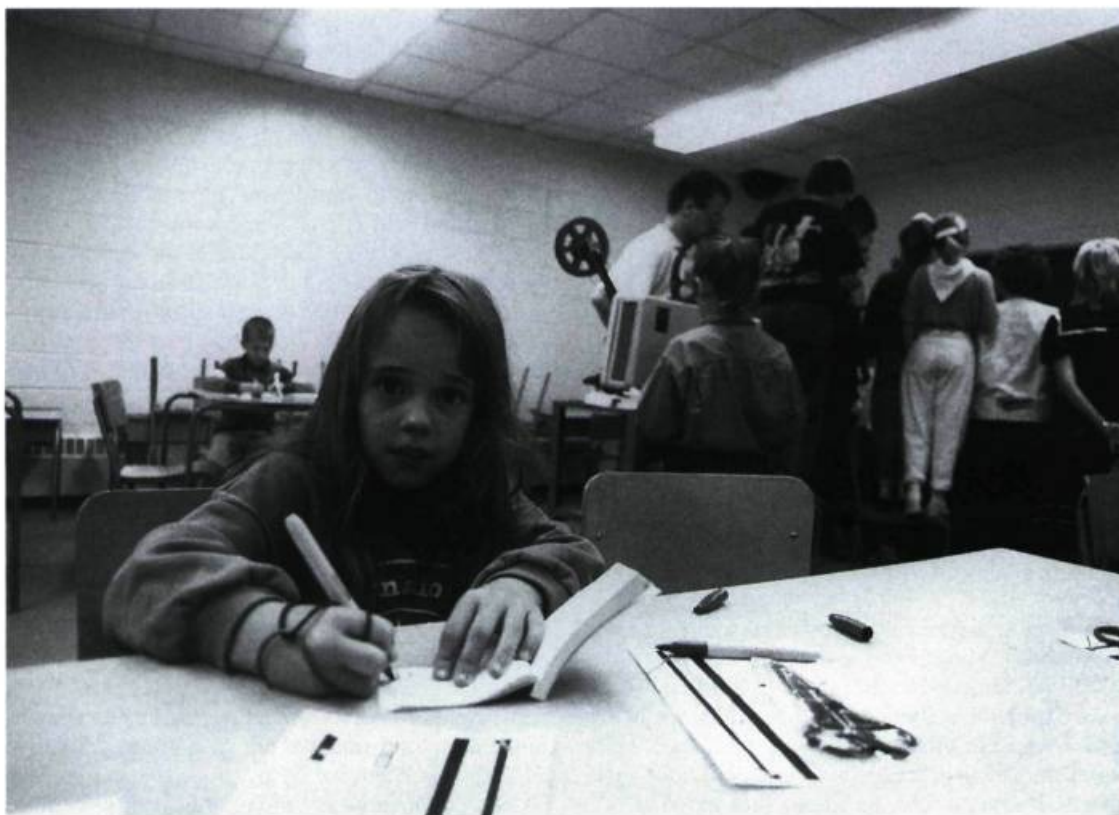
Un atelier d'initiation au cinéma dans le cadre du Carrousel international du film de Rimouski

quatre heures pour un film parce qu'il n'y avait pas consensus parmi les membres du jury; ils l'ont revisionné. Les discussions ne se limitent pas à: "j'aime ça, j'aime pas ça". Personne n'a le droit d'assister à leurs délibérations. Quand les caméras de télévision se pointent, ils simulent des discussions. Jamais, dans leur travail, ils ne subissent de pressions venant d'adultes ou de professionnels du cinéma. Et contrairement à d'autres festivals, nous n'avons qu'un seul jury. À Berlin, par exemple, il y a le jury UNICEF, un jury formé de professionnels et de jeunes.»