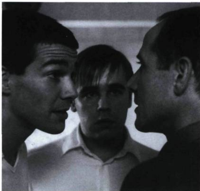
Funny Games de Michael Haneke

5 - On peut en conclure que, si l'espace médiatique et l'espace personnel se superposent, ils le font de manière qu'aucun de ces univers ne communiquent. Et là encore il n'y a pas vraiment d'opposition, puisque tous deux se structurent finalement de la même façon en témoignant d'une même incommunicabilité. Les séquences d'actualités que Haneke intercale dans ses films sont, comme ceux des véritables téléjournaux, à montage discontinu: un reportage sur Sarajevo peut précéder les derniers développements du procès intenté contre Michael Jackson pour pédophilie. L'examen des parties génitales de la star s'interprète au même niveau de sens que la fin du cessez-le-feu en Bosnie pour la période de Noël. Et l'individu intègre pour lui-même cette discontinuité comme une façon d'être: les encadrés qui tapissent le mur de la salle à manger des parents de Benny font cohabiter une reproduction de la Joconde, des lépidoptères épinglés, un tableau d'Andy Warhol, une vieille pub de Pepsi-Cola, la photo d'une cuisine, etc. Et c'est peu dire que, dans cet univers,