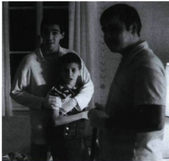
Funny Games de Michael Haneke

«jeu» de Haneke avec le spectateur interfère de manière contradictoire avec l'entomologisme propre au regard de ses films précédents.