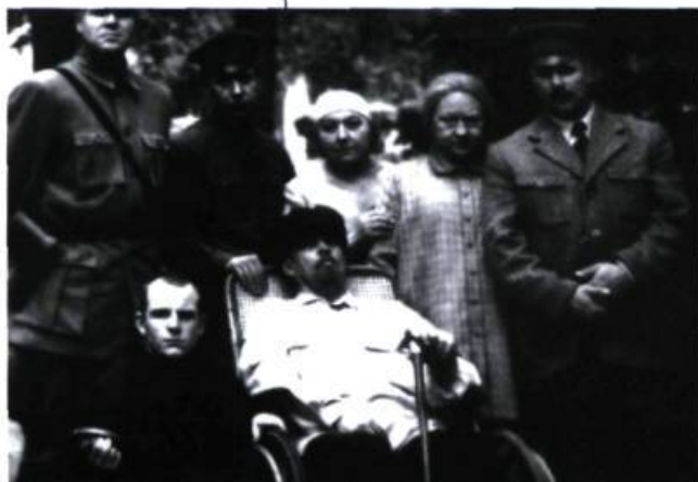
Taurus d'Alexandre Sokurov

L'art de Sokurov ne se base pas sur l'emphase. Il tend vers l'abstraction, mais certaines scènes n'échappent pas à la caricature, dans leur façon de se moquer des chefs politiques, de